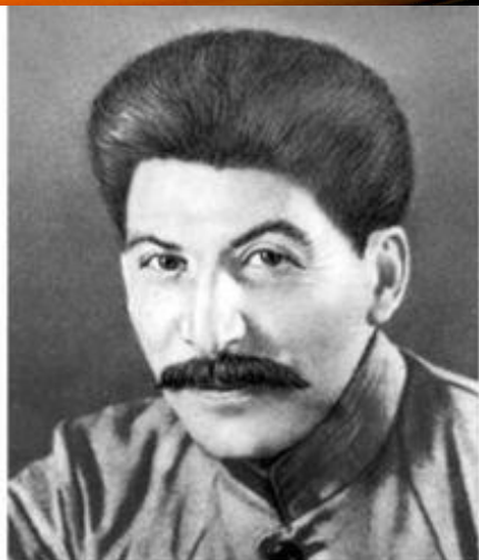
Сталин Иосиф Виссарионович