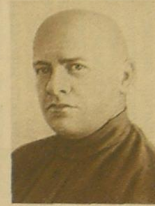
С. В. КОСИОР.