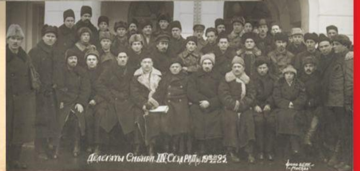
Делегаты Сибир. ЦК КПС, 1925 г.

2 АН. СОСНИН ТЯ /БОЛЬШЕВИКОВ/ ИТ агуста 1942 г. С/секретно. отс ИСП/4/ с участием ИНА, от 28 января И. И.