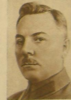
К. Е. ВОРОШИЛОВ.