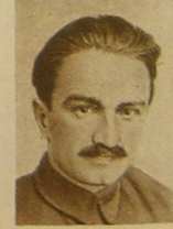
А. И. МИКОЯН.