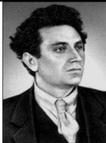
Зиновьев Григорий Евсеевич