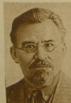
Г. И. ПЕТРОВСКИЙ.