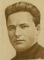
С. М. КИРОВ.