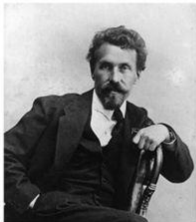
Рыков Алексей Иванович