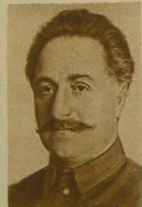
Г. К. ОРДЖОНИКИДЗЕ.