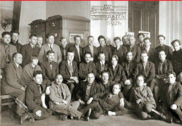
XII Коллектив Партийного комитета Сибирского ЦК КПС 1928 г.

2 АН. СОСНИН ТЯ /БОЛЬШЕВИКОВ/ ИТ агуста 1942 г. С/секретно. отс ИСП/4/ с участием ИНА, от 28 января И. И.