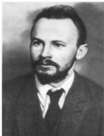
Бухарин Николай Иванович