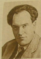
В. В. КУЙБИШЕВ.