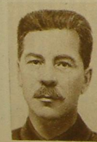
П. П. ПОСТЫШЕВ.