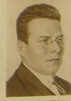
Я. Э. РУДЗУТАК.