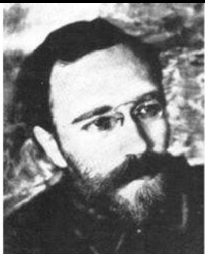
Каменев Лев Борисович