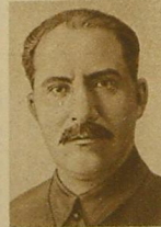
Л. М. КАГАНОВИЧ.