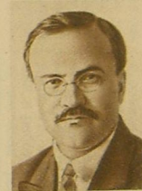
В. М. МОЛотов.