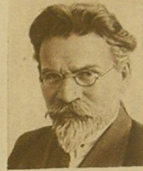
М. И. КАЛИНИН.