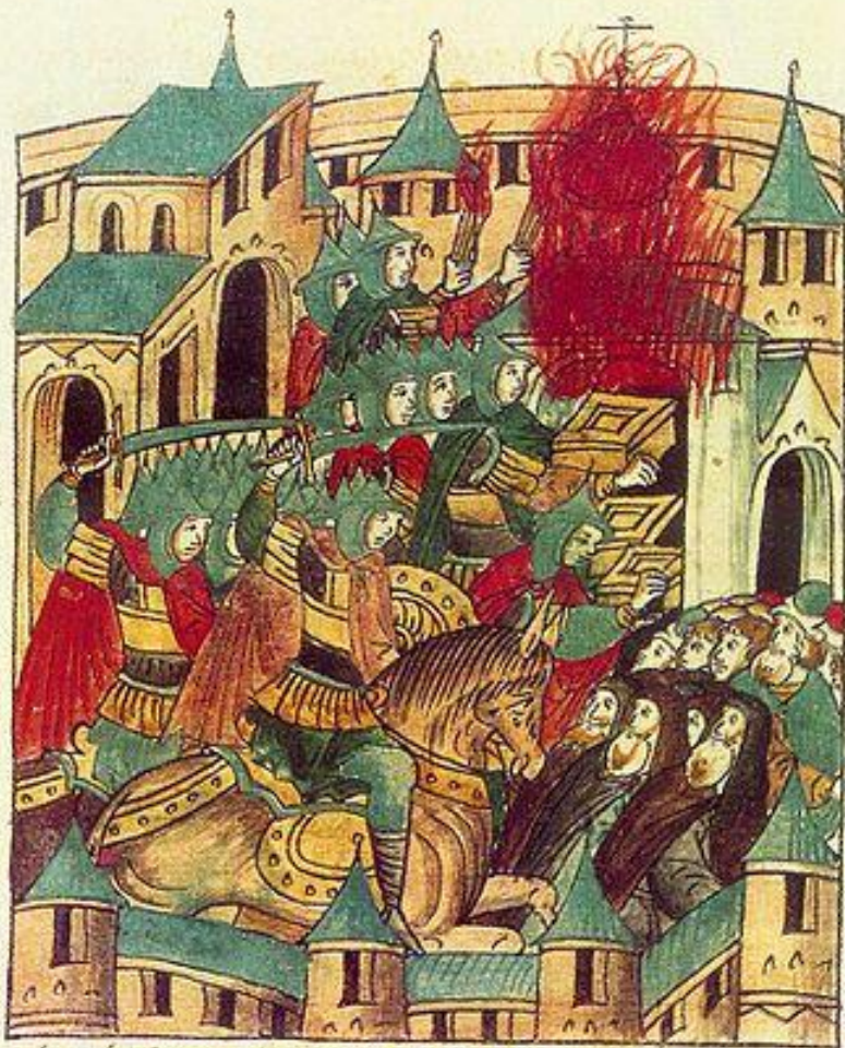
Повесть о разорении Рязани Батыем. Разорение Рязанской земли. Миниатюра. Лицевой свод XVI в. Древний летописец, т. II. (Ленинград, БАН)

И шедъше по злша граю уздаль : и црь Никоде стюю бѣоу разграбѣша . а про че есе шгнѣ мь по жь го ша