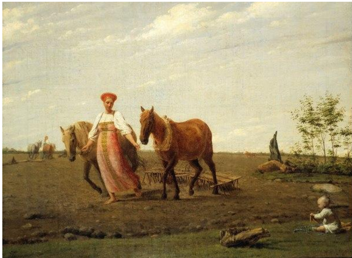
Алексей Венецианов. «На пашне. Весна», первая половина 1820 г.

Картины бытового жанра служат прекрасным инструментом для изучения нравов, обычаев и особенностей взаимоотношений людей разных исторических эпох.