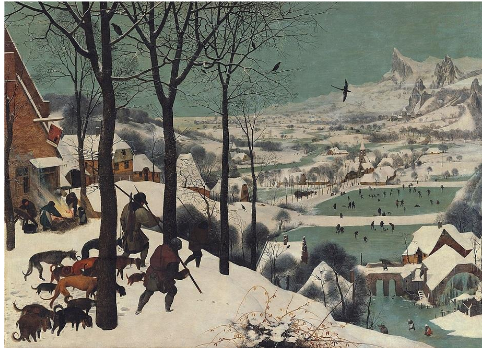
Питер Брейгель Старший «Охотники на снегу», 1565 г.

В Европе бытовой жанр начал набирать популярность в эпоху Ренессанса. Мастера стали добавлять в свои картины на религиозную тематику ранее недопустимые изображения из повседневной жизни. Появились первые миниатюры, гравюры и светские росписи, посвященные народному быту.