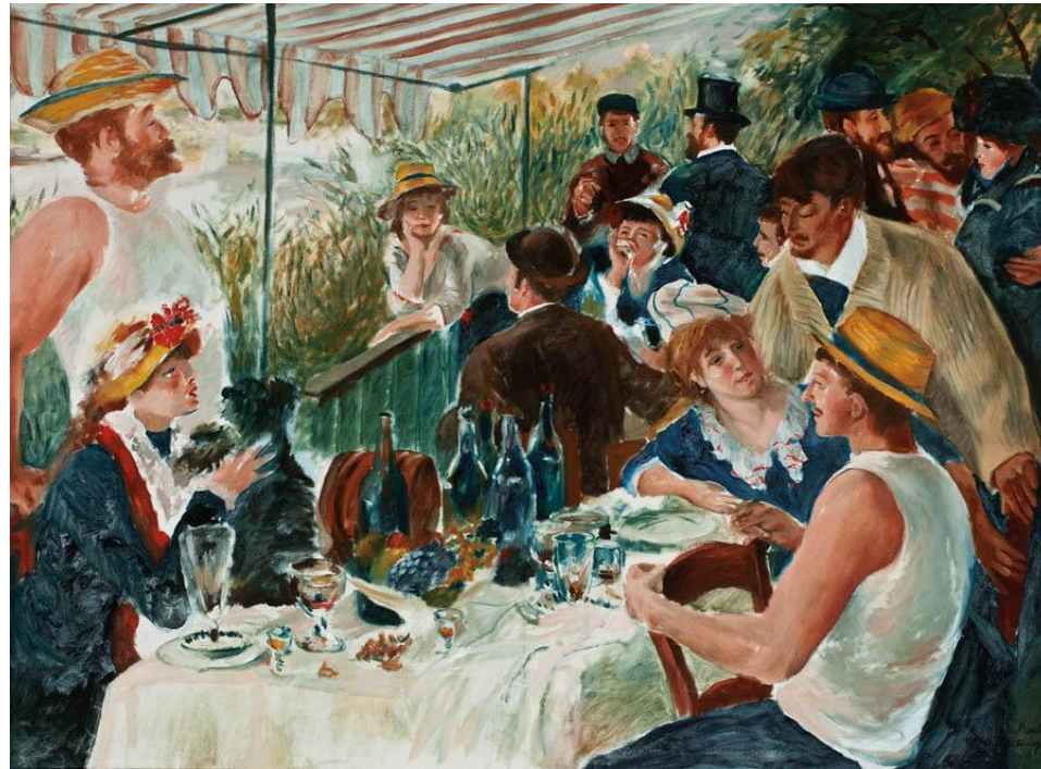
Огюст Ренуар (Франция) «Завтрак гребцов», 1800-1801 гг.

В 18 веке происходит перелом в отношении к бытовой тематике. Именитые художники обращаются к этому направлению чаще, работая в стилях реализм, классицизм, романтизм. Популярности направления способствует заинтересованность в бытовых сюжетах со стороны коллекционеров.