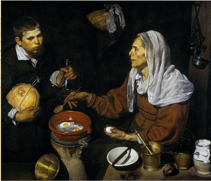
Диего Веласкес «Старая женщина, готовящая яичницу», около 1618 г.

В XVII веке наступил Золотой век голландской живописи . В этот период многие художники обращаются в своем творчестве к быту соотечественников. Картины на повседневные сюжеты пишут Веласкес, Рубенс и многие другие.