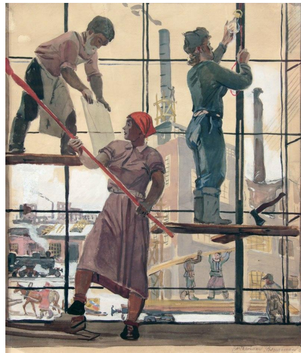
А. Дейнека. «Восстановление Ростсельмаша»