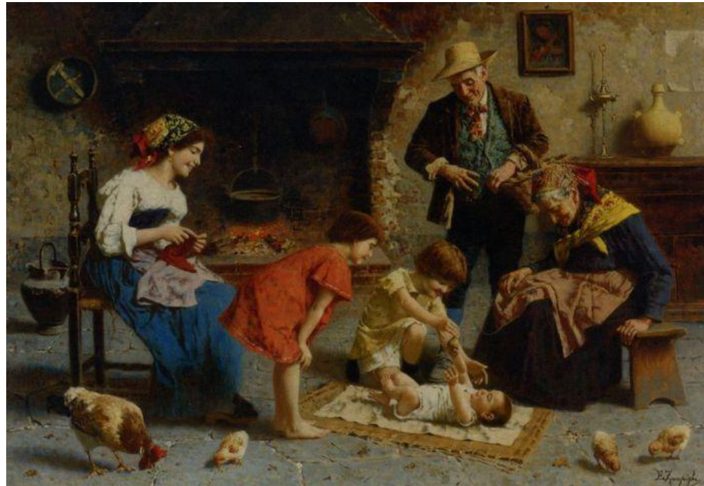
Эугенио Эдуардо Дзампиги (Италия) 1859-1944 гг. «Игра с ребенком»