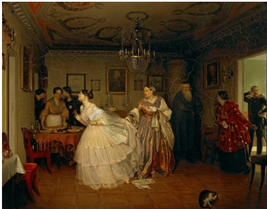
П. А. Федотов. «Сватовство майора», 1848 г.

Русская живопись тяготела к бытовому направлению. Основоположником этого жанра в российском искусстве по праву считают А. Г. Венецианова . Он воспел гимн крестьянам своими произведениями.. Среди признанных мастеров бытового жанра П. А. Федотов , В. Г. Перов . Их картины не только рассказывают о жизни того времени, но и обличают пороки прогнившего общества. Их стремление к справедливости было подхвачено передвижниками.