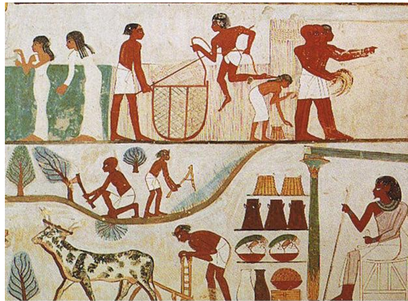
Стенопись с бытовыми сценами, погребальная кладовая Накта, Древний Египет

Бытовой жанр встречается в Древнем Египте. На росписях стен гробниц и дворцов часто встречаются обычные сцены из жизни крестьян. Но эти картинки занимают второстепенное положение на фоне монументальных религиозных изображений.