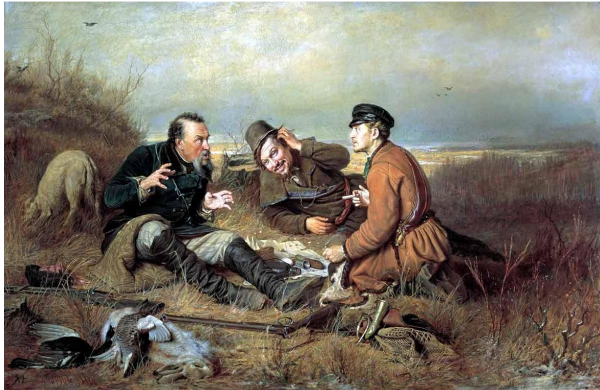
Василий Григорьевич Перов «Охотники на привале», 1871 г.

Быт – жизненный уклад, повседневный уклад (Из словаря С.И.Ожегова)