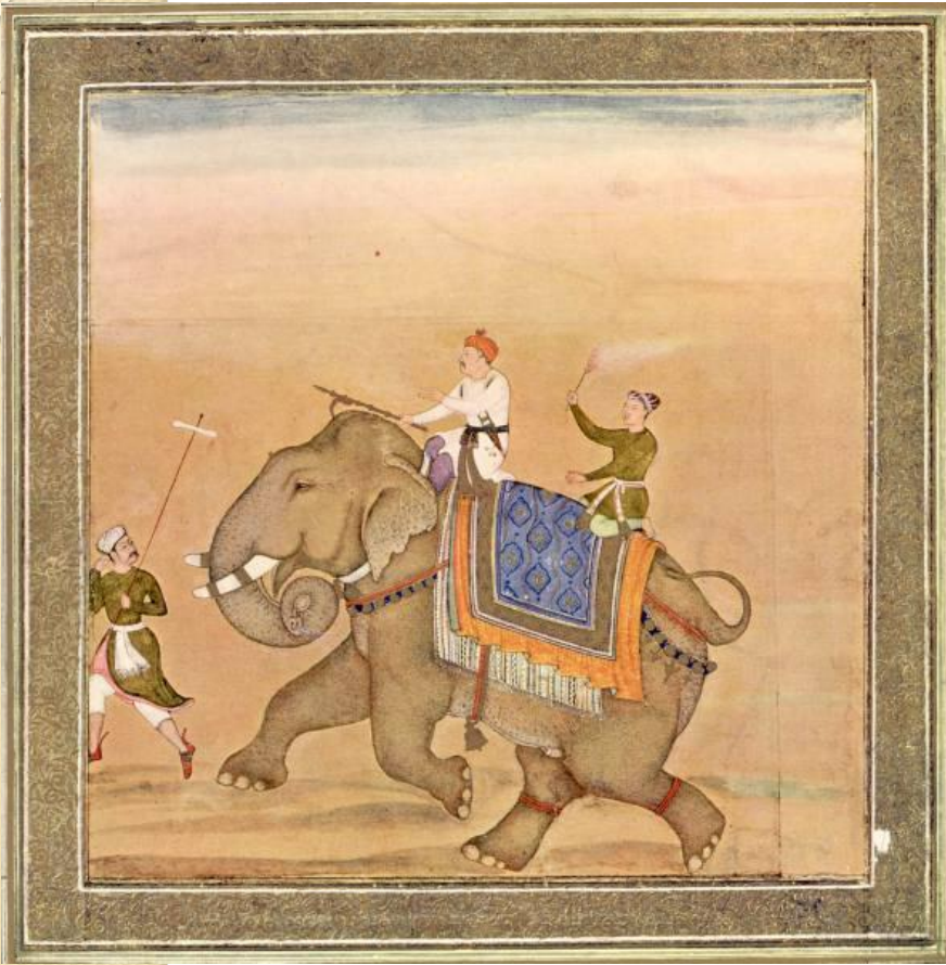
«Акбар верхом на слоне» Индия, начало 1600 г. Автор не известен

В странах Востока рисунки на темы быта чаще всего носили поучительный или юмористический характер. До наших дней дошли немногочисленные произведения мастеров из Китая, Японии, Кореи и Индии. А мусульманские мастера искусства вынуждены были считаться с запретом изображения фигур человека и животных.