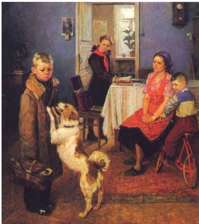
Ф. Решетников. «Опять двойка», начало 1950-х гг.

Тематикой работ 20 века стали войны, революции, глобальные преобразования быта. Появляется много картин с изображением рабочих, школьников и т.д.