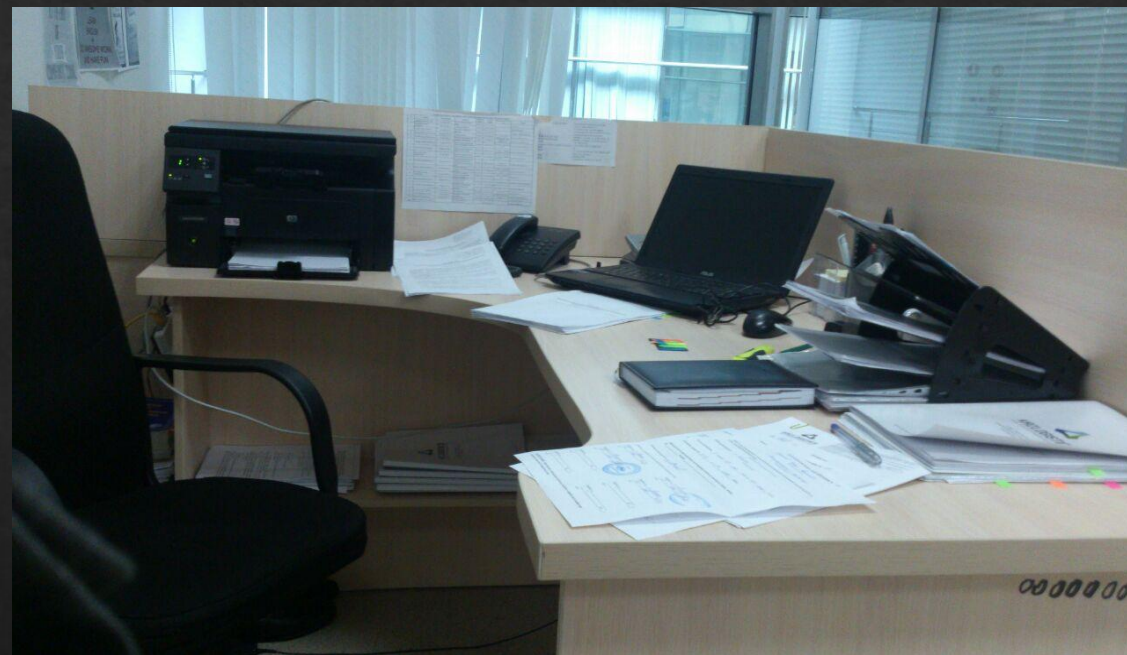
Мое рабочее место