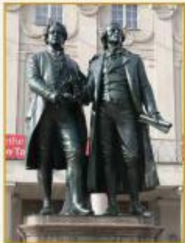
Памятник Гёте и Шиллеру у здания театра в Веймаре