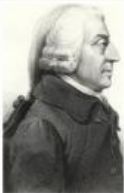
Адам Смит 1723 – 1790 г.г.