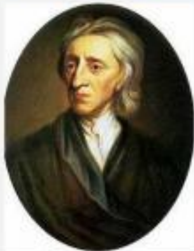
Джон Локк 1632 – 1704 г.г.