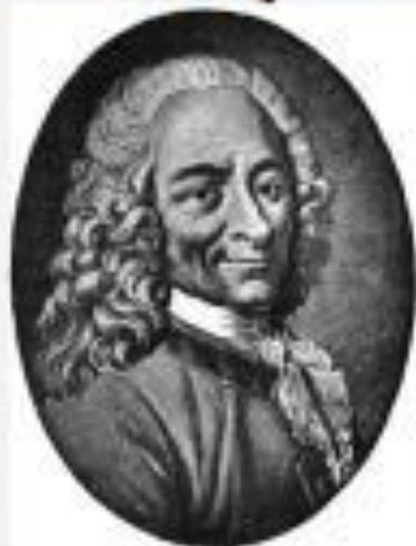
Вольтер Франсуа Мари Аруэ (1694-1778 гг.)