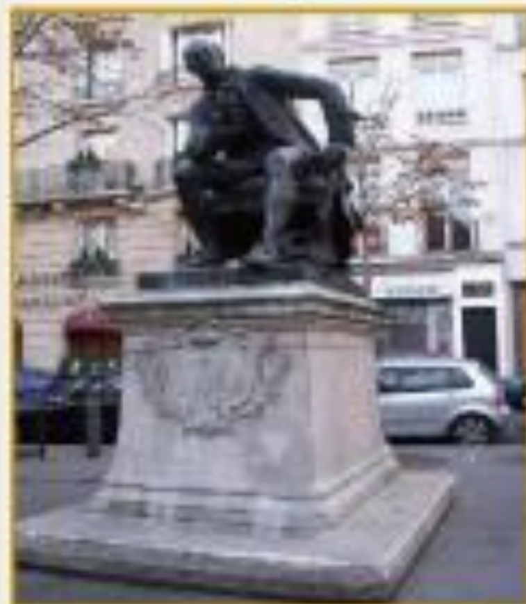
Памятник Д. Дидро в Париже