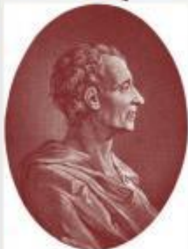
Шарль Луи Монтескье (1689-1755 г.г.)