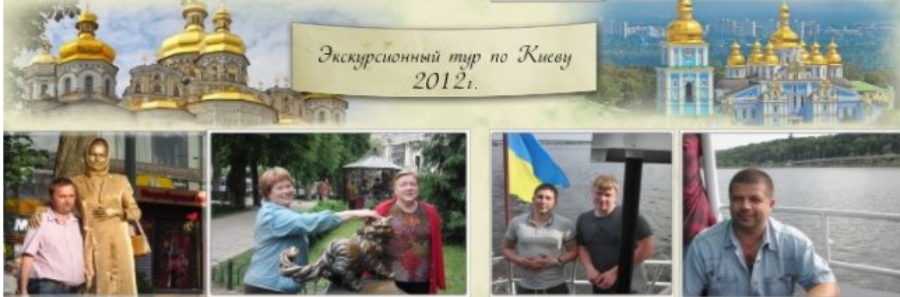
Экскурсионный тур по Киеву 2012г.