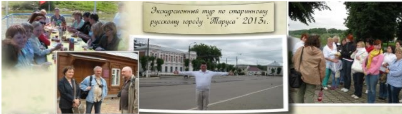
Экскурсионный тур по старинному русскому городу "Ярослав" 2013г.