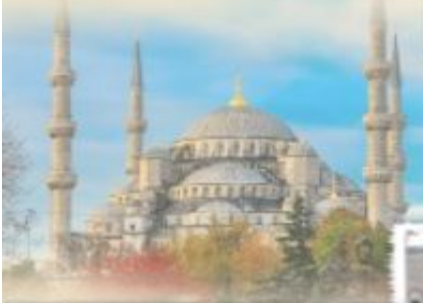
Экскурсионный тур "Стамбул" ноябрь 2012г.