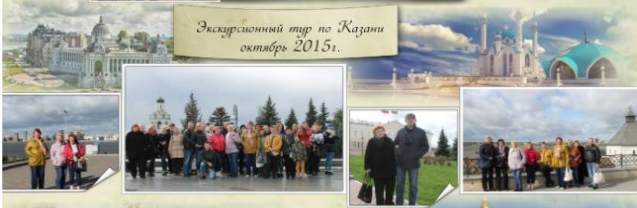
Экскурсионный тур по Казани октябрь 2015г.