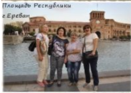
Площадь Республики г.Ереван