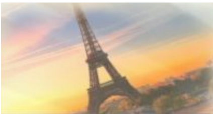
Экскурсионный тур "Париж" 2013г.