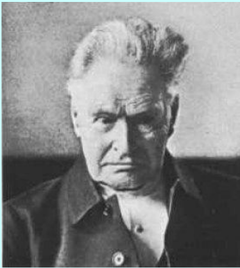
сэр Эдмунд Бекетт

Спроектировали часы сэр Эдмунд Бекетт и королевский астроном Джордж Эйри .