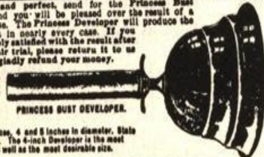
PRINCESS BUST DEVELOPER.

comes in two sizes, 4 and 5 inches in diameter. State size desired. The 4-inch Developer is the most popular as well as the most desirable size.