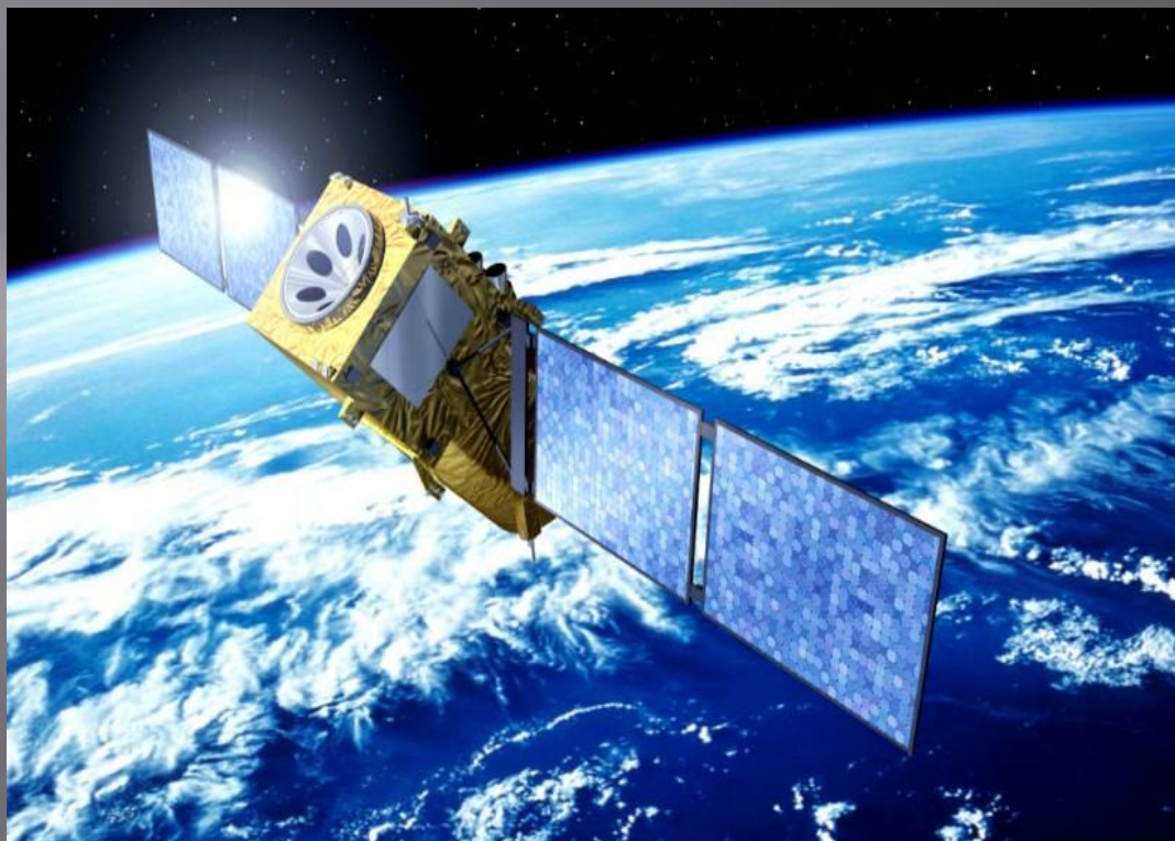
Российский военный спутник "Молния"

В космической навигационной системе используются десятки высокостабильных стандартов частоты и времени со сложной системой синхронизации их функционирования. Метрологически они обеспечиваются непосредственно на военных эталонах времени и частоты с применением мобильных эталонов-переносчиков. Современные приёмники сигналов космической навигационной системы являются высокоточными средствами измерений, ими оснащаются образцы ВТО.