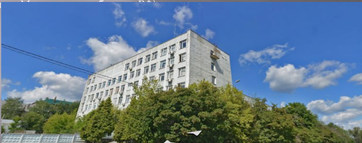
«Главный научный метрологический центр» Министерства обороны РФ

В 1974 году в Минобороны СССР были образованы метрологическая служба Вооружённых Сил с дислокацией в г. Москве и 32-й метрологический центр Минобороны с размещением в г. Мытищи Московской области (ныне Федеральное государственное бюджетное учреждение «Главный научный метрологический центр Минобороны России»).