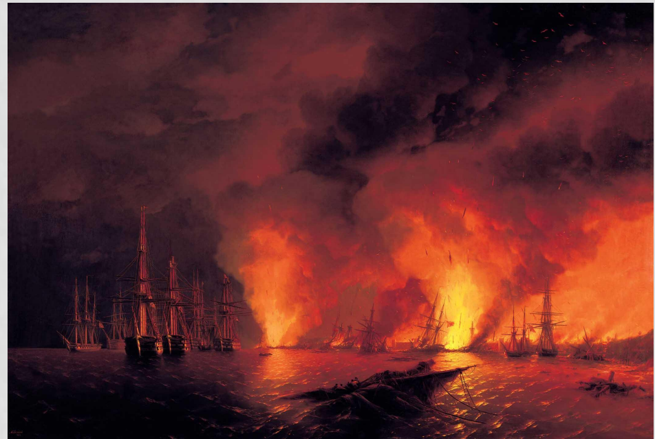
И. Айвазовский Синопский бой. Ночь после боя.