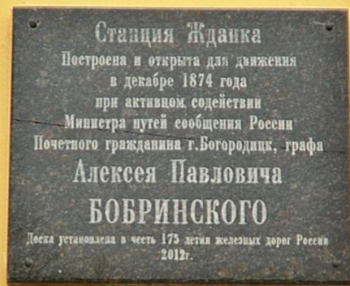
Памятная доска на здании вокзала

Вскоре император назначил Бобринского управляющим железными дорогами, потом – министром путей сообщения и очень заботился об устройстве железнодорожной сети в Тульской губернии.