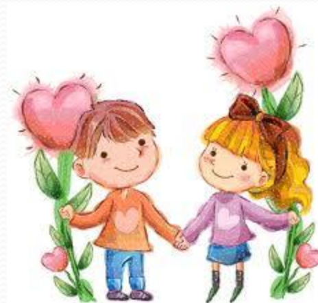
Яша и Шура