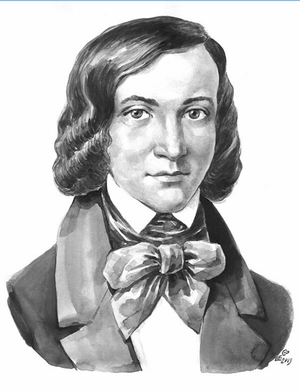
Кружок Станкевича, 1831 – 1839 гг.

Руководители: Н.В. Станкевич, К.С. Аксаков, Т.Н. Грановский, В.Г. Белинский, М.А. Бакунин