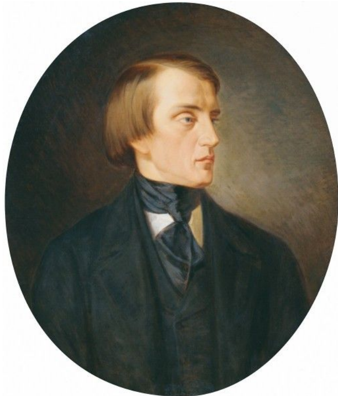
Виссарион Григорьевич Белинский