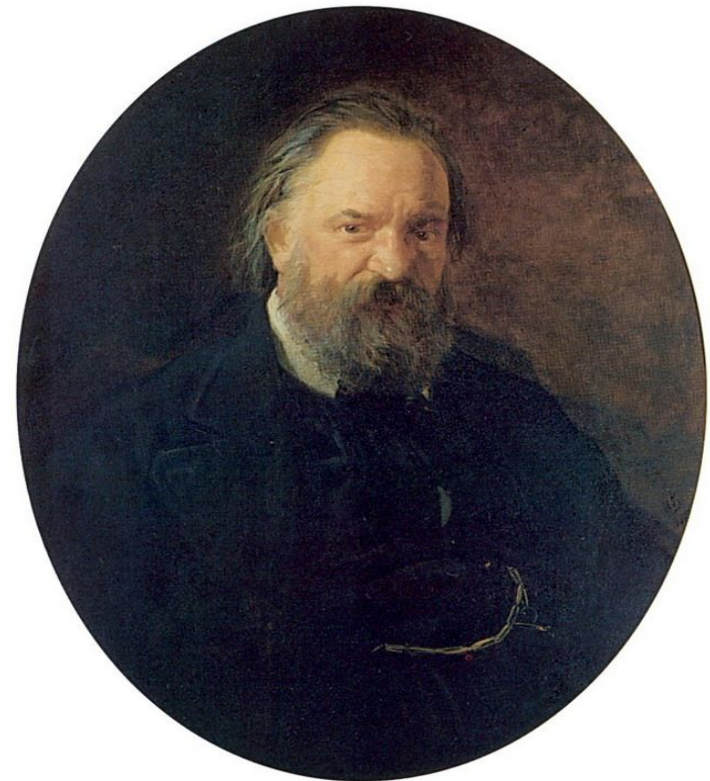
Александр Иванович Герцен