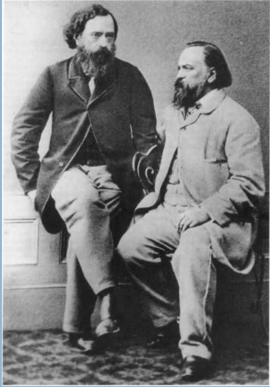
Кружок Герцена и Огарева, 1831 – 1834 гг.