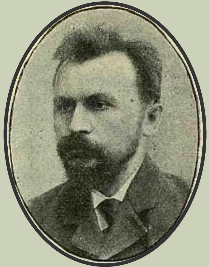
С. Н. Булгаков, 1907 год.

Окончил юридический факультет Московского университета, в 1890-х годах увлекался марксизмом, был близок к социал-демократам. Смысл дальнейшей мировоззренческой эволюции Булгакова вполне определенно передает заглавие его книги От марксизма к идеализму (1903).