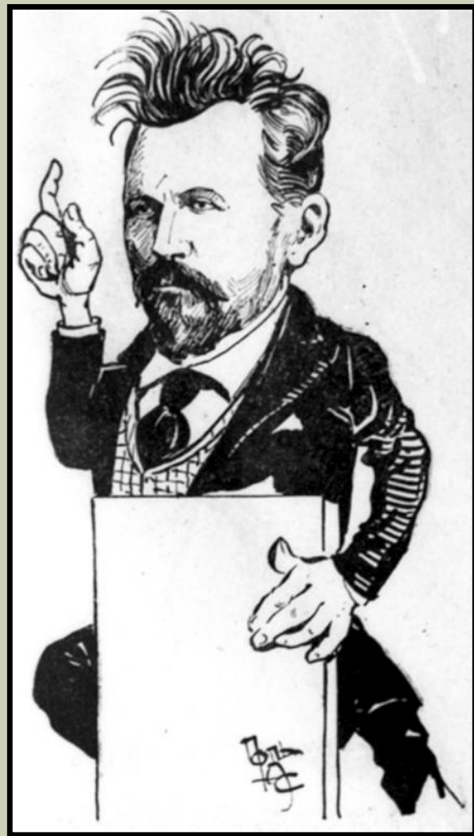
Карикатура на депутата Государственной Думы С. Н. Булгакова. 1907 год.

Он участвует в сборниках Проблемы идеализма (1902) и Вехи (1909), в религиозно-философских журналах «Новый путь» и «Вопросы жизни», издательстве «Путь». Религиозно-метафизическая позиция Булгакова нашла вполне последовательное выражение в двух его сочинениях: Философия хозяйства (1912) и Свет Невечерний (1917). В 1918 он стал священником, в 1922 был выслан из России. С 1925 и до конца своих дней руководил Православным богословским институтом в Париже.