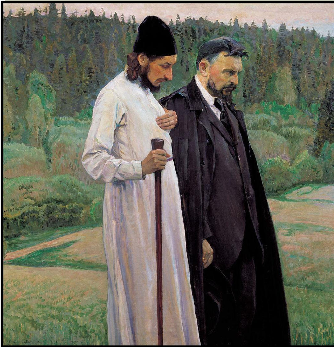
Павел Флоренский и Сергей Булгаков. Картина «Философы» художника М. В. Нестерова

В философских и богословских трудах Булгакова центральную роль играет софиология.