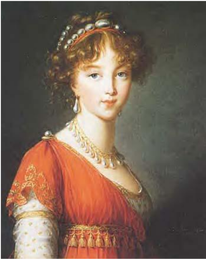
Елизавета Алексеевна (1779-1826)