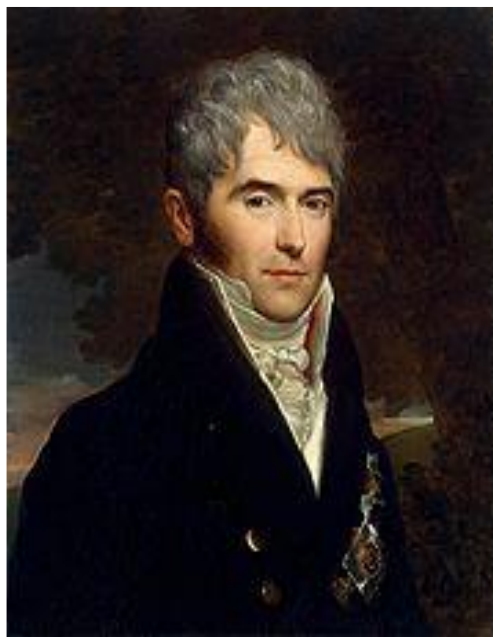
В.П. Кочубей (1768-1834)