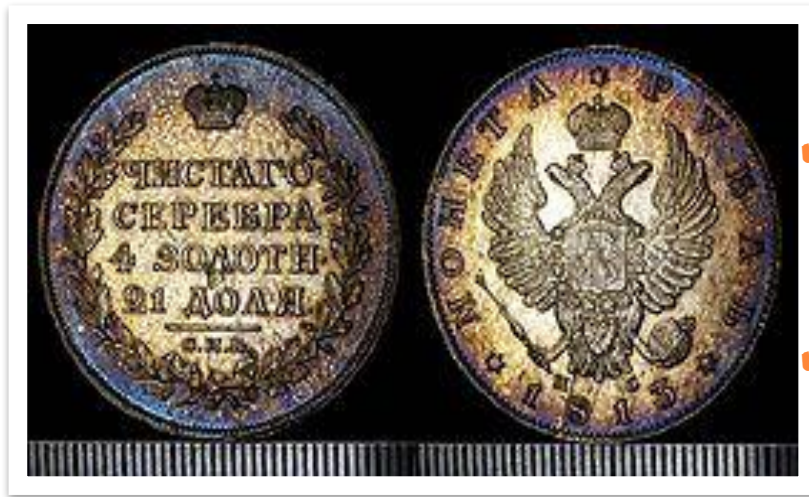
Рубль Александра I серебром. 1813 г.