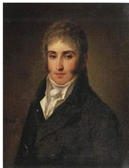
А. Чарторыйский (1770-1861)