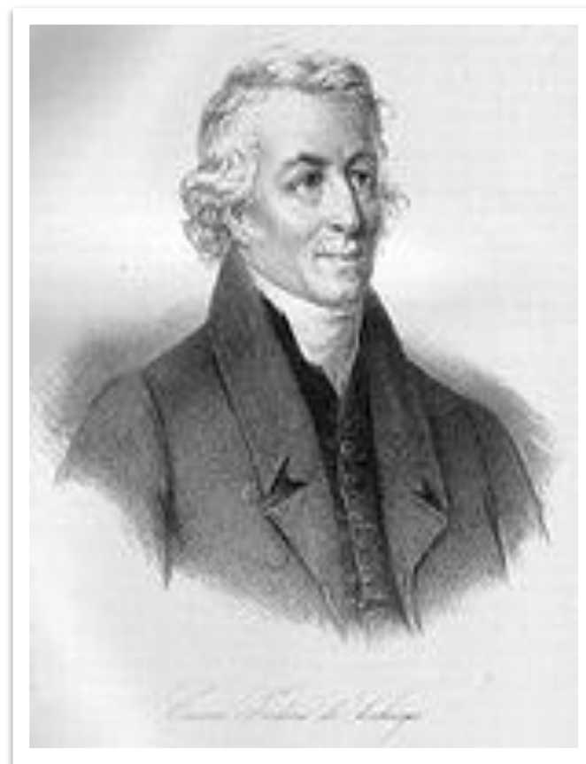
Фредерик Сезар Лагарп, воспитатель Александра I