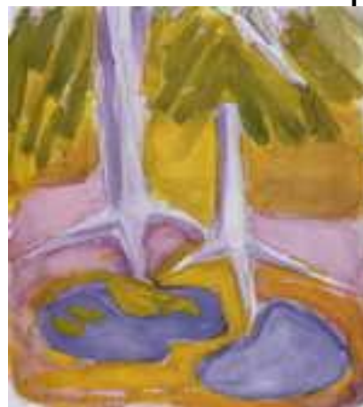
Е. Гуро Корни деревьев