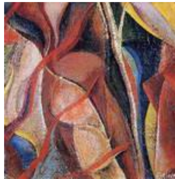
Д. Бурлюк Ветер