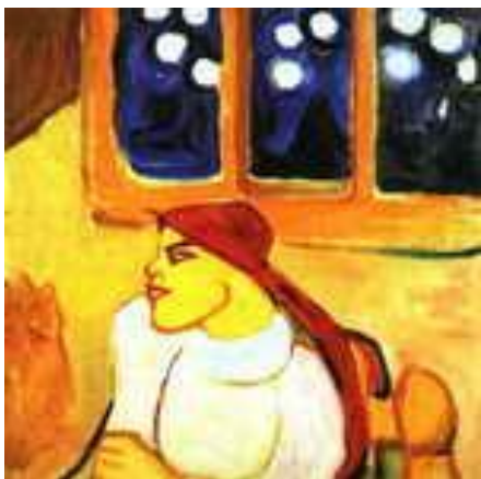
Е. Гуро Женщина в платке