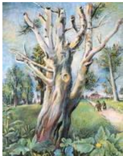
Д. Бурлюк В парке