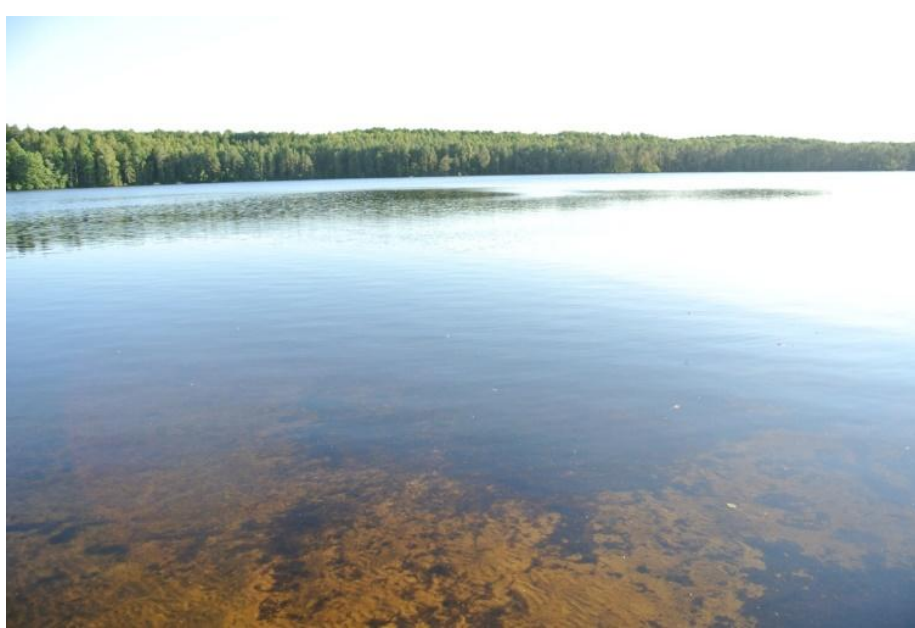
Самое прозрачное озеро – Нужьяр (8 м).