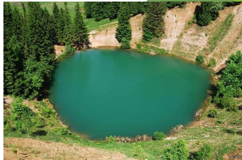
Самое известное озеро – это Морской глаз.