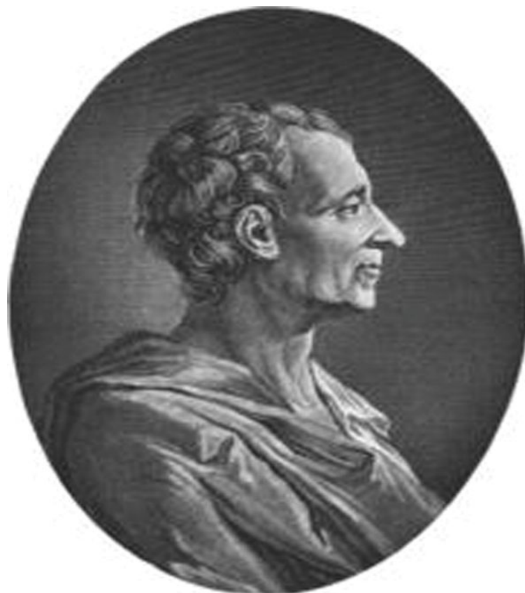
Шарль Луи Монтескье