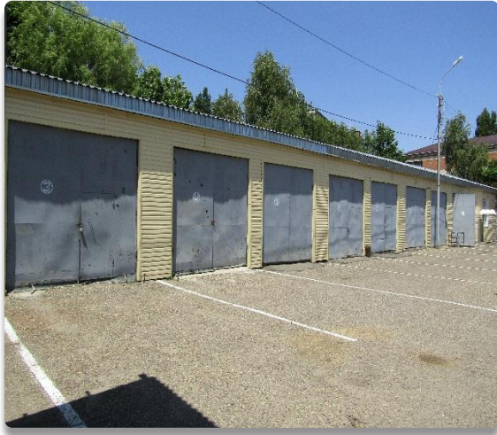
Рис. 29 Боксы для автобронетехники (Литер Л)