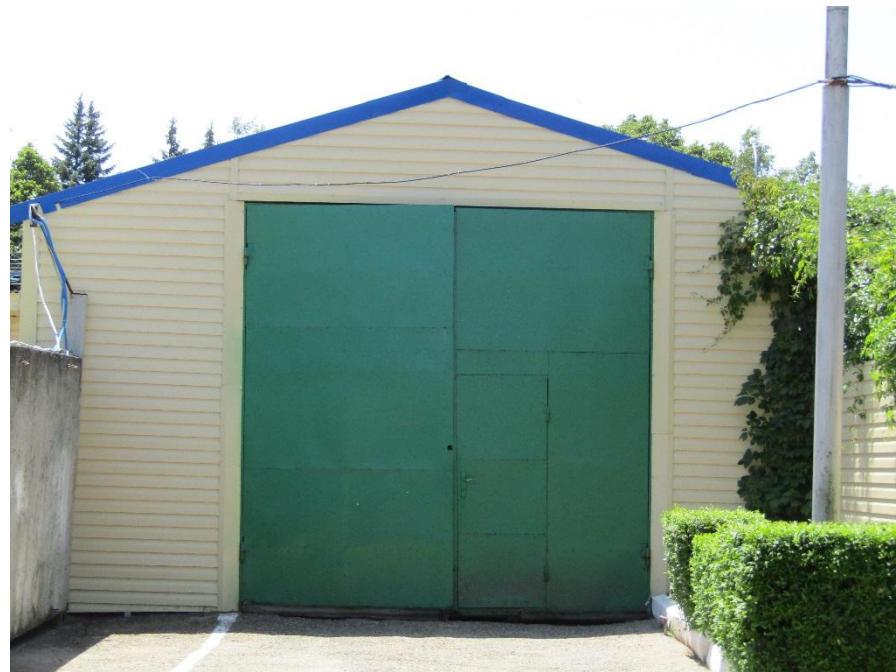
Рис. 33 Мойка автомашин (Литер Н)