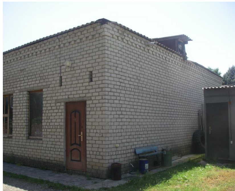
Рис. 37 Административное здание ст. Курская