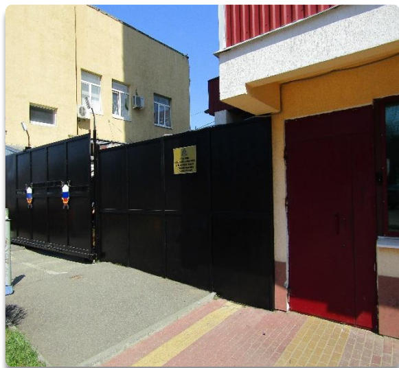
Рис. 1 Контрольно-пропускной пункт, въезд со стороны проезжей части