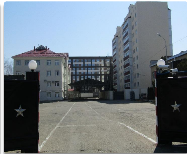
Рис. 6 Административное здание (Литер Б), общежитие для сотрудников ОМОН