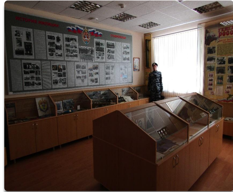
Рис. 13 Музей боевой славы