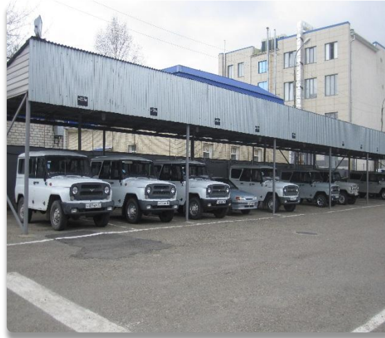
Рис. 30 Место стоянки легковых автомобилей