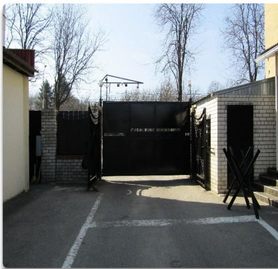
Рис. 2 Контрольно-пропускной пункт, выезд со стороны ОМОН