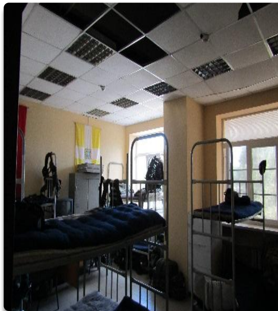
Рис. 22 Служебные помещения 2 этажа