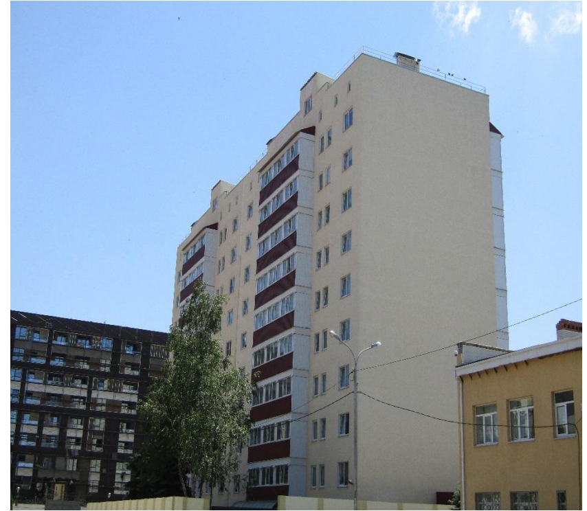
Рис. 27 Фасад Общежития (Литер А) со стороны проезжей части Тыльная сторона Общежития (Литер А) со стороны ОМОН