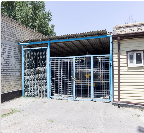
Рис. 40 Территория ОВ г. Нефтекумск