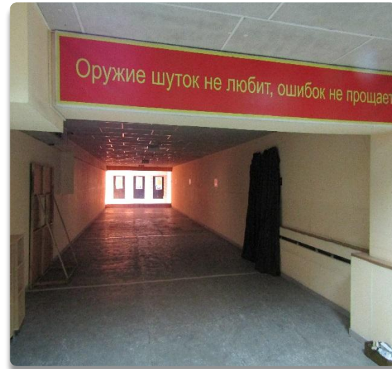
Рис. 9 Стрелковый тир