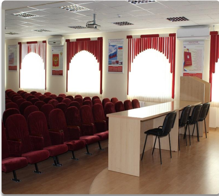
Рис. 12 Актовый зал