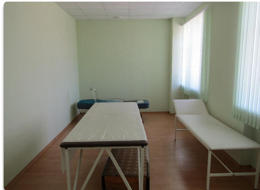
Рис. 15 Процедурная комнаты психологической разгрузки