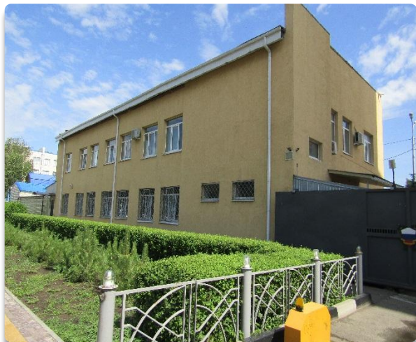
Рис. 18 Фасад Административного здания (Литер С) со стороны проезжей части