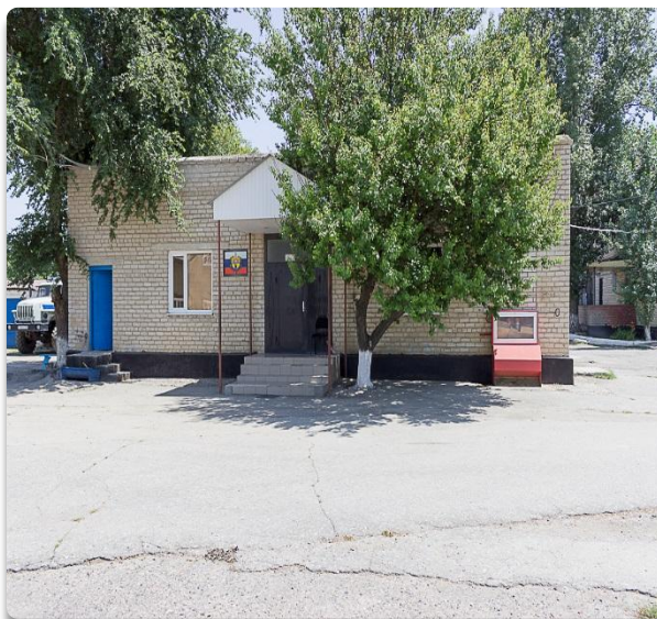
Рис. 41 Территория ОВ г. Нефтекумск