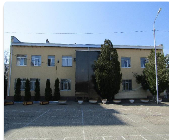
Рис. 20 Фасад Административного здания (Литер С) со стороны плаца ОМОН