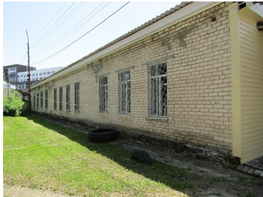
Рис. 16 Фасад Административного здания (Литер С) Тыльная сторона Административного здания (Литер С)