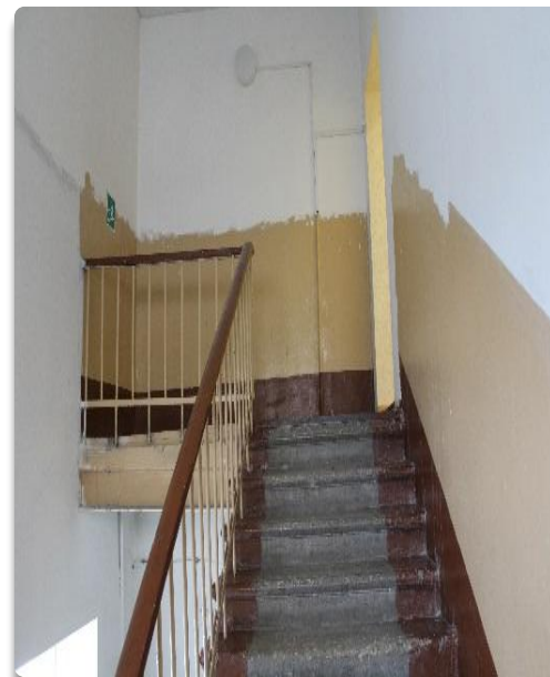
Рис. 23 Лестничные пролеты