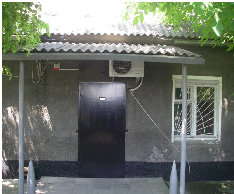
Рис. 36 Административное здание ст. Курская