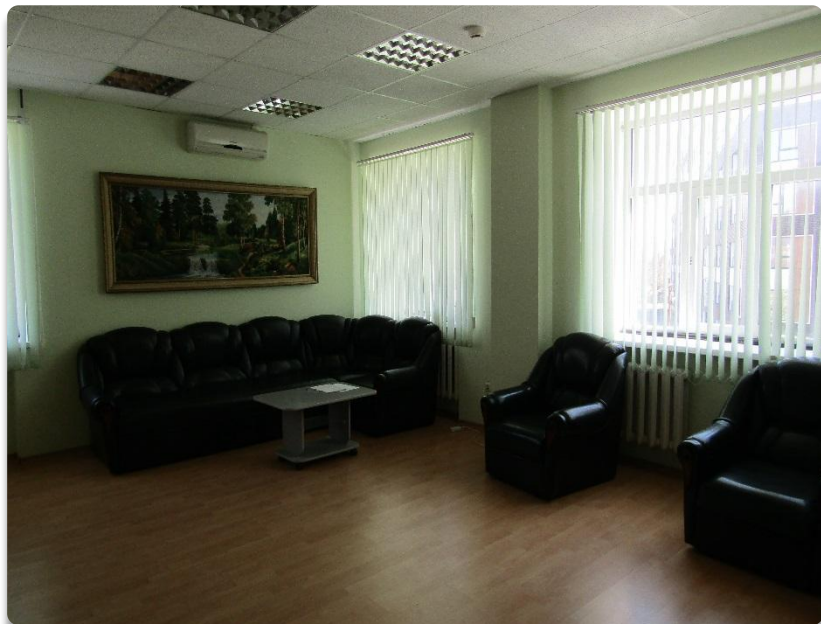
Рис. 14 Комната психологической разгрузки