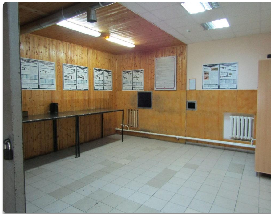
Рис. 11 Помещение зарядания – разрядания оружия