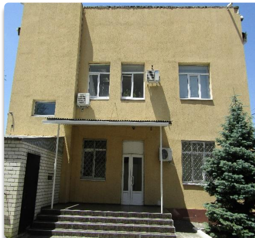
Рис. 19 Фасад Административного здания (Литер С)