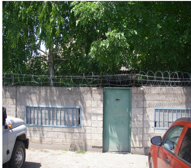
Рис. 39 Стоянка для автотранспорта ст. Курская