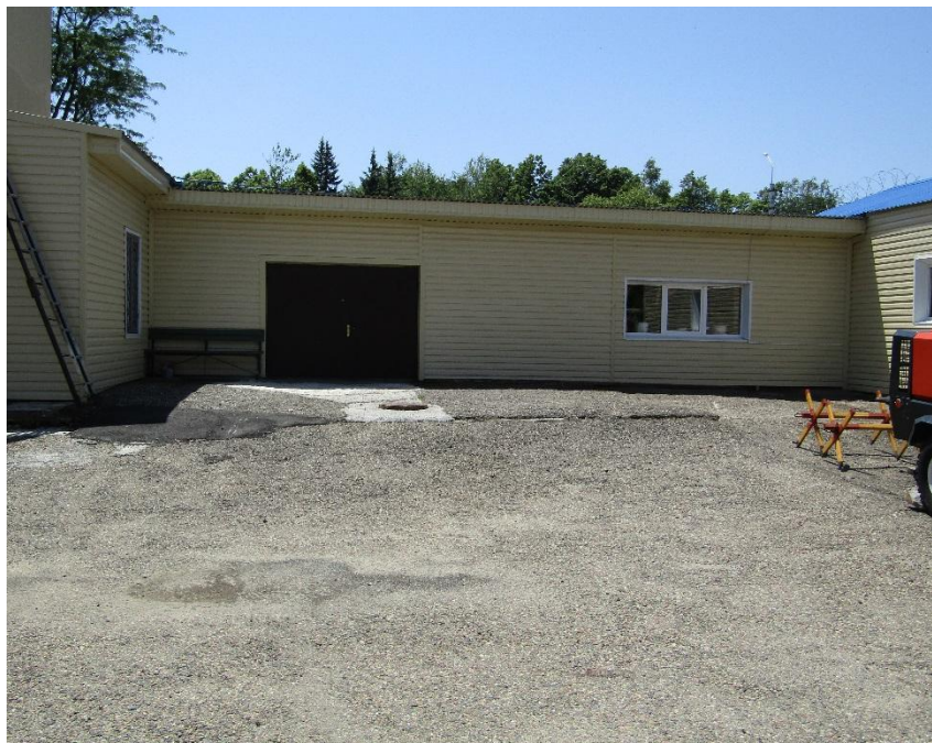
Рис. 32 Гаражи, складское (Литер Т)