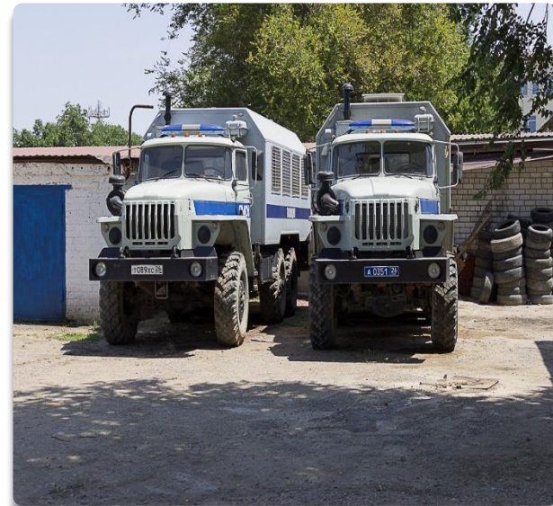
Рис. 42 Территория ОВ г. Нефтекумск