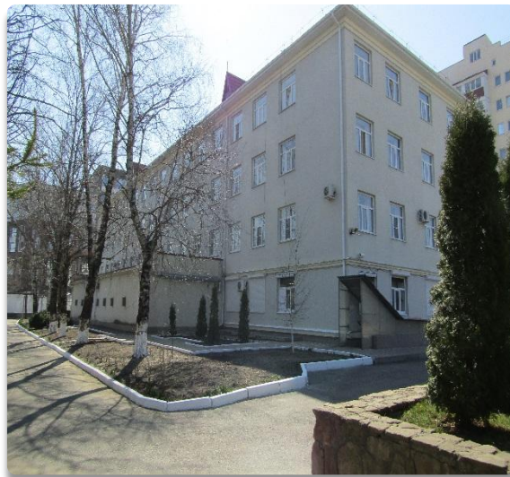
Рис. 5 Фасад Административного здания (Литер Б)