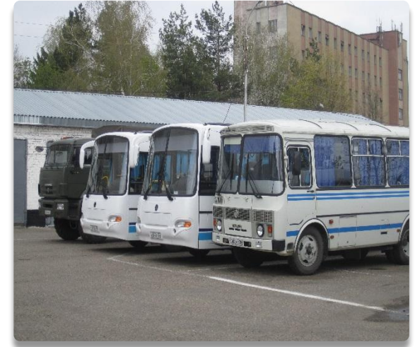
Рис. 31 Место стоянки автомобильной техники