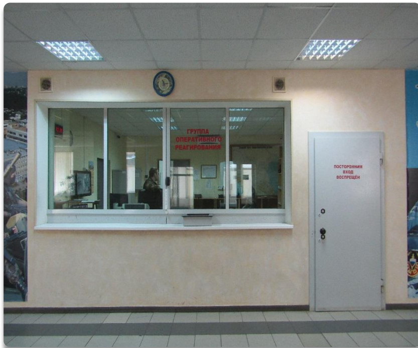
Рис. 10 Вход в помещение группы оперативного реагирования ОМОН