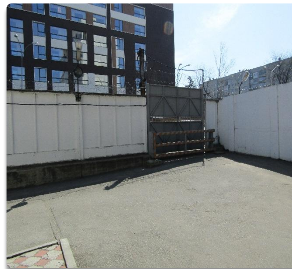
Рис. 3 Запасные въездные ворота