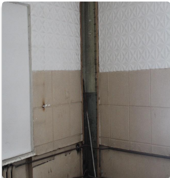
Рис. 21 Служебные помещения 1 этажа