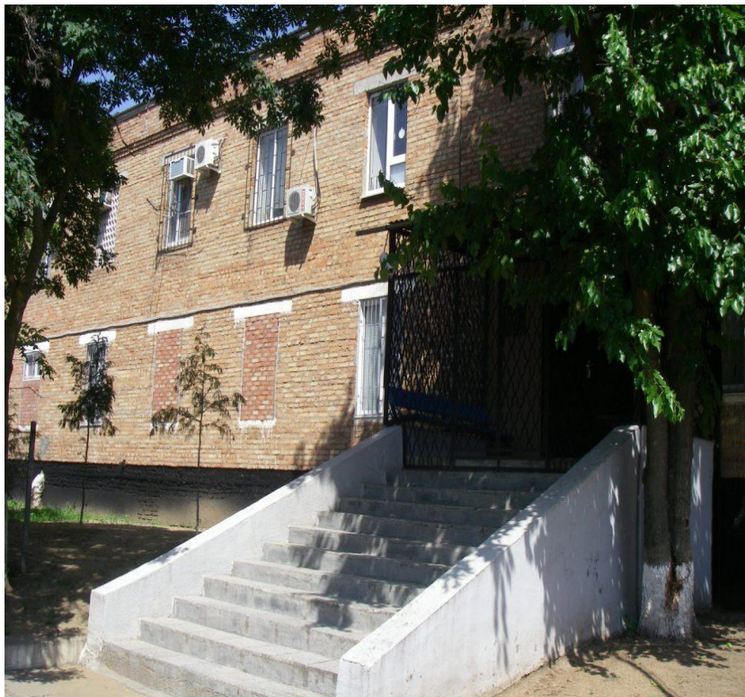
Рис. 34 Фасад административного здания ОМВД по