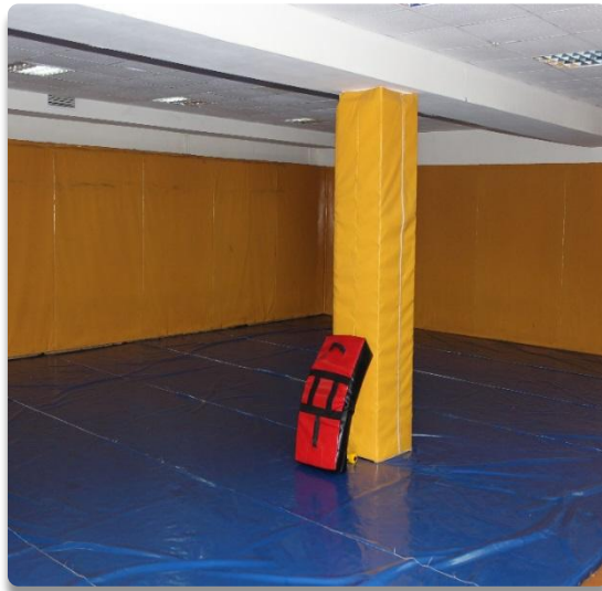
Рис. 8 Учебно-материальная база, борцовский зал