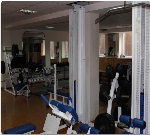
Рис. 7 Учебно-материальная база, тренажерный зал