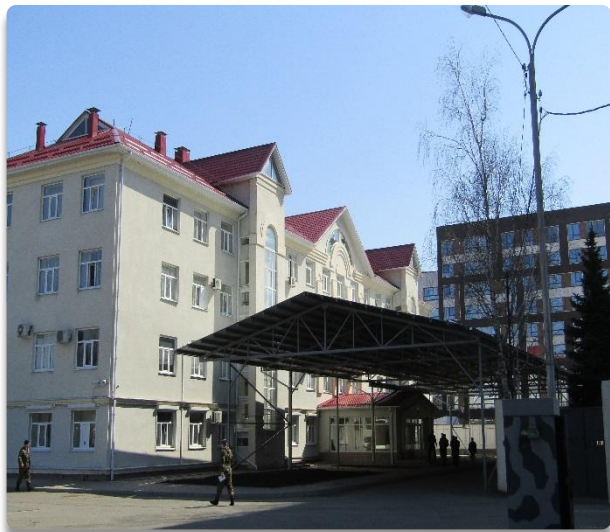
Рис. 4 Фасад Административного здания (Литер Б)