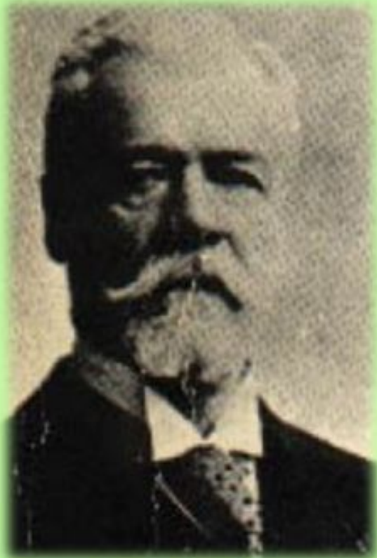
Анри Файоль (1841-1925)