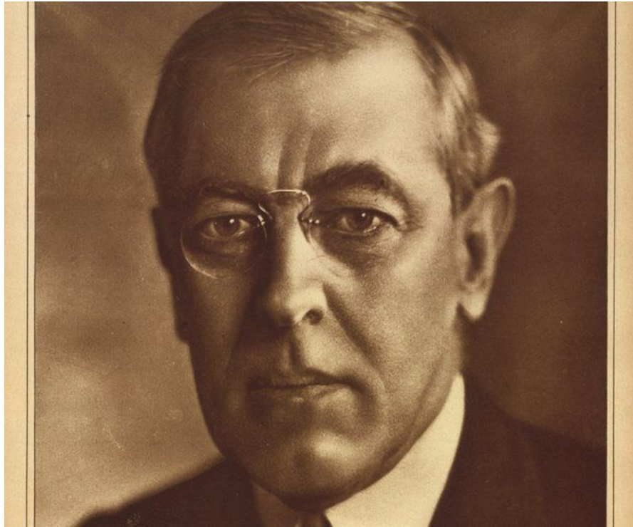
ВУДРО ВИЛЬСОН, 28 Президент США (1856 – 1924)