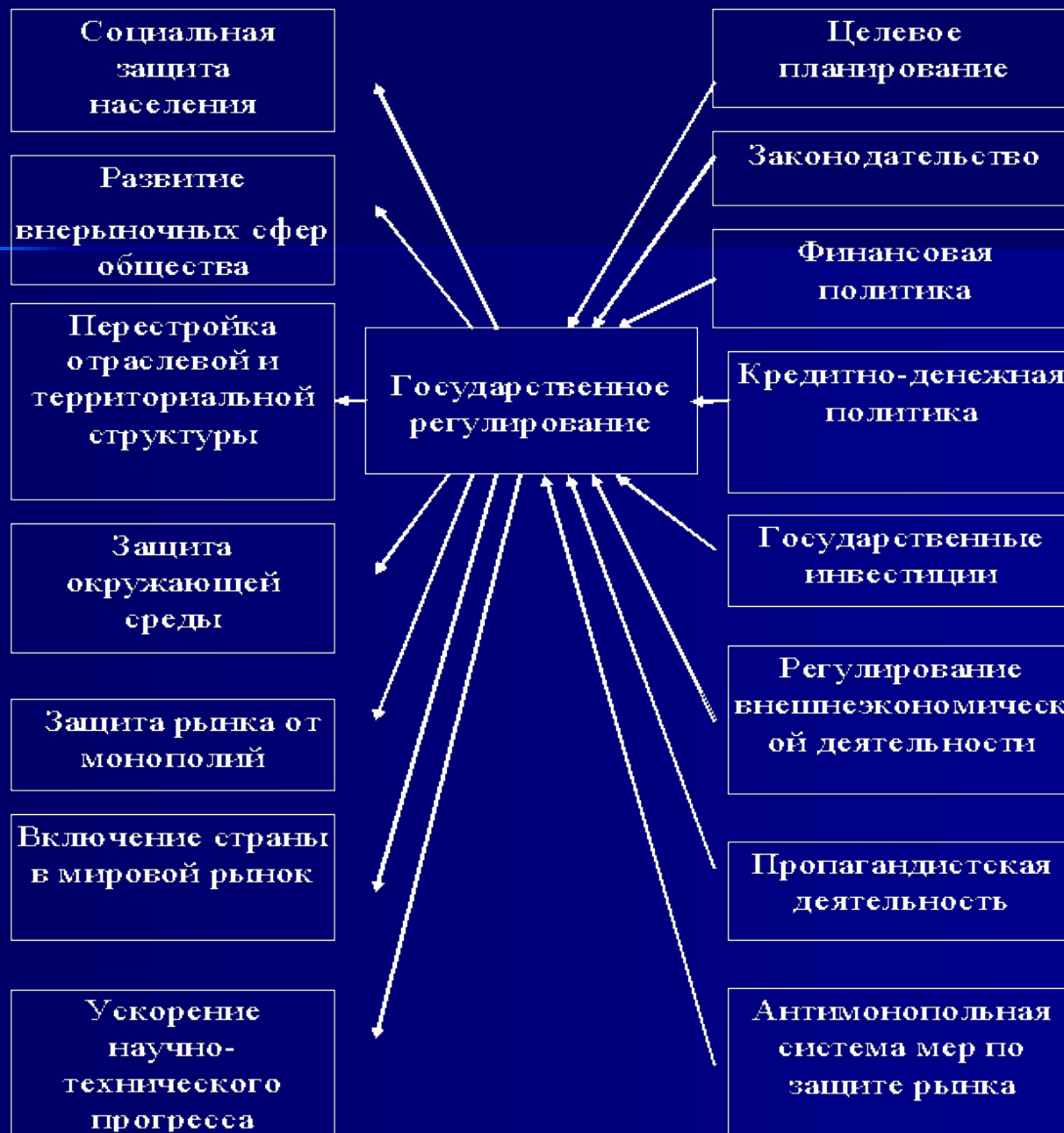
Схема 1. Цели и методы государственного регулирования