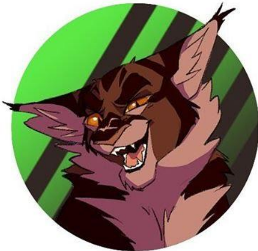
Звездоцап (слева) Бич (справа)

Это нападение сломало Крошке жизнь. Он решил отомстить Звездоцапу, но не знал, как это сделать. Однажды Звездоцап пришёл к Бичу с предложением объединить усилия. В итоге перед всеми четырьмя Племенами Бич убил своего злейшего врага.