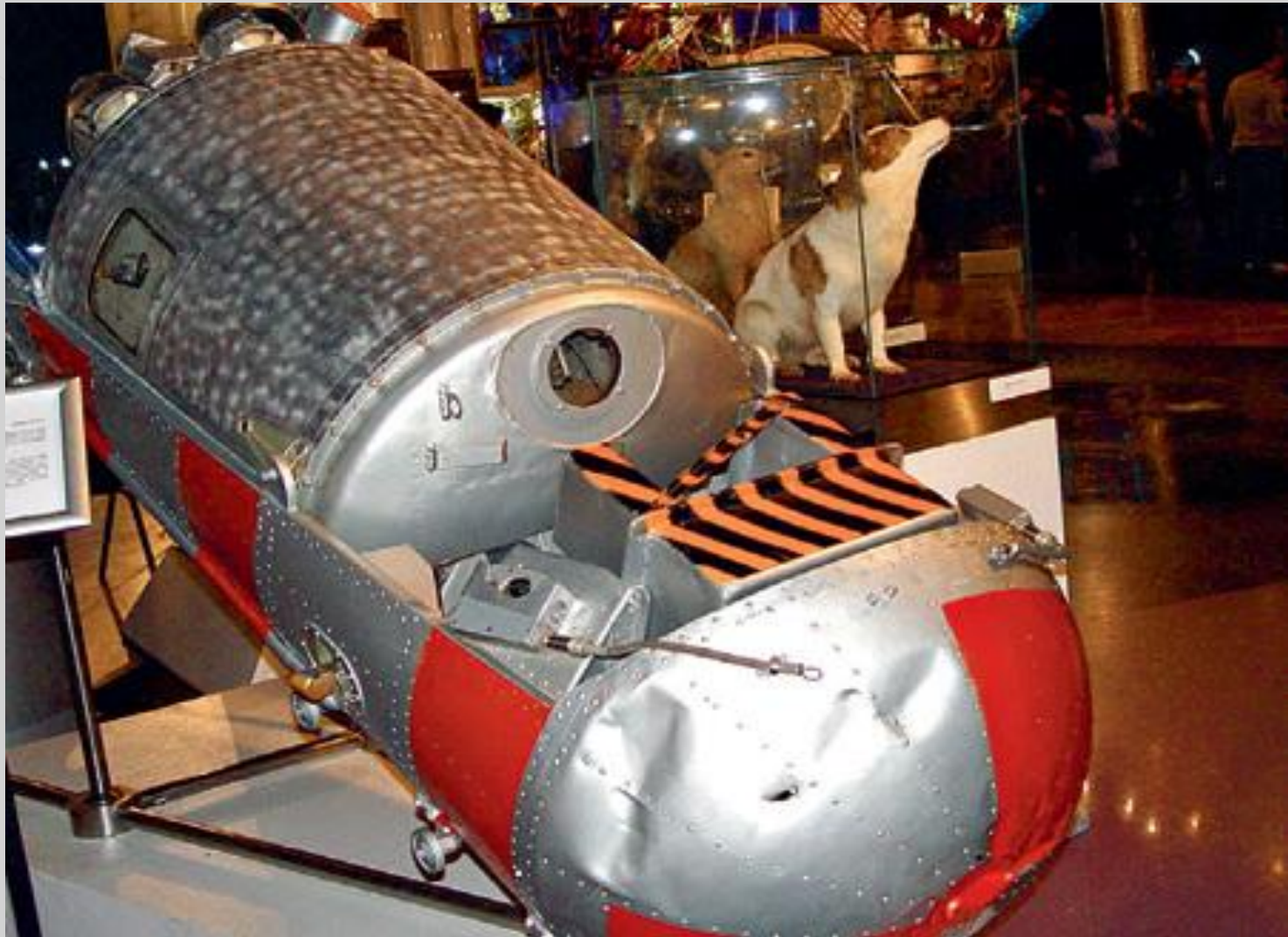
Капсула, в которой приземлились легендарные собаки