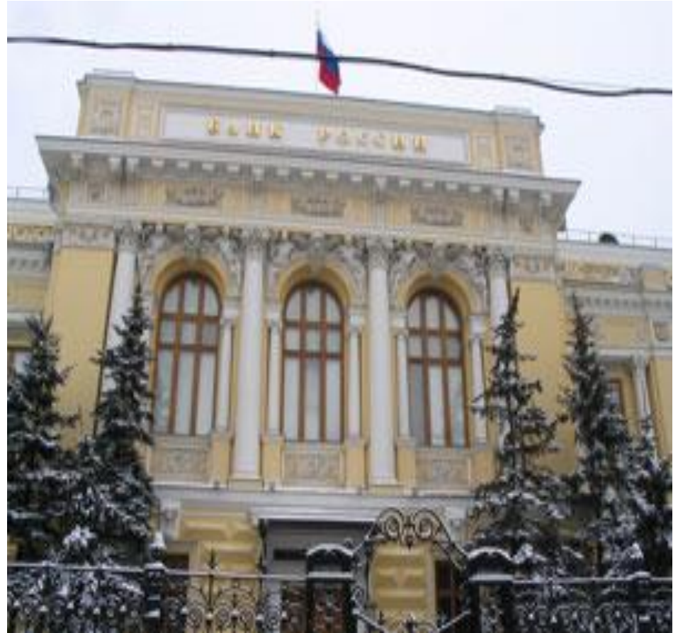
Банк России, Москва

(central bank) — главный банк страны, который имеет исключительное право на эмиссию национальной валюты и контролирует деятельность других банков