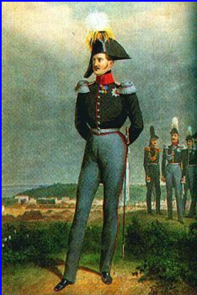
Николай I. Гравюра 19 в.

Указ о майоратах. Для укрепления своей социальной опоры, Николай запретил дробить крупные имения