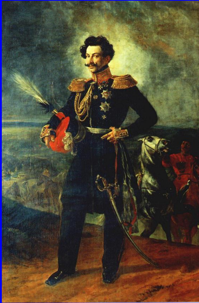
К.Брюллов. Граф В.А.Перовский

В 30-е гг.Россия установила протекторат над казахскими жузами, в этом районе началось строительство укреплений. Но на казахские земли претендовала Хива поддерживаемая англичанами.