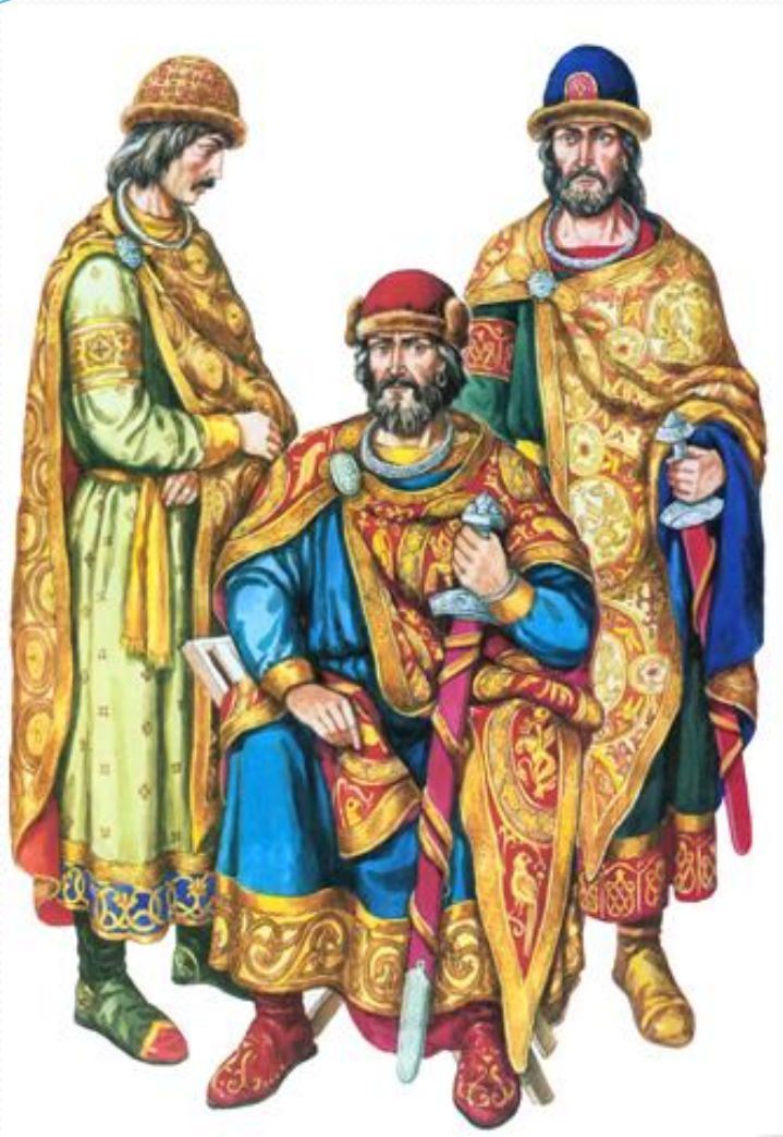
Київський князь з придворними