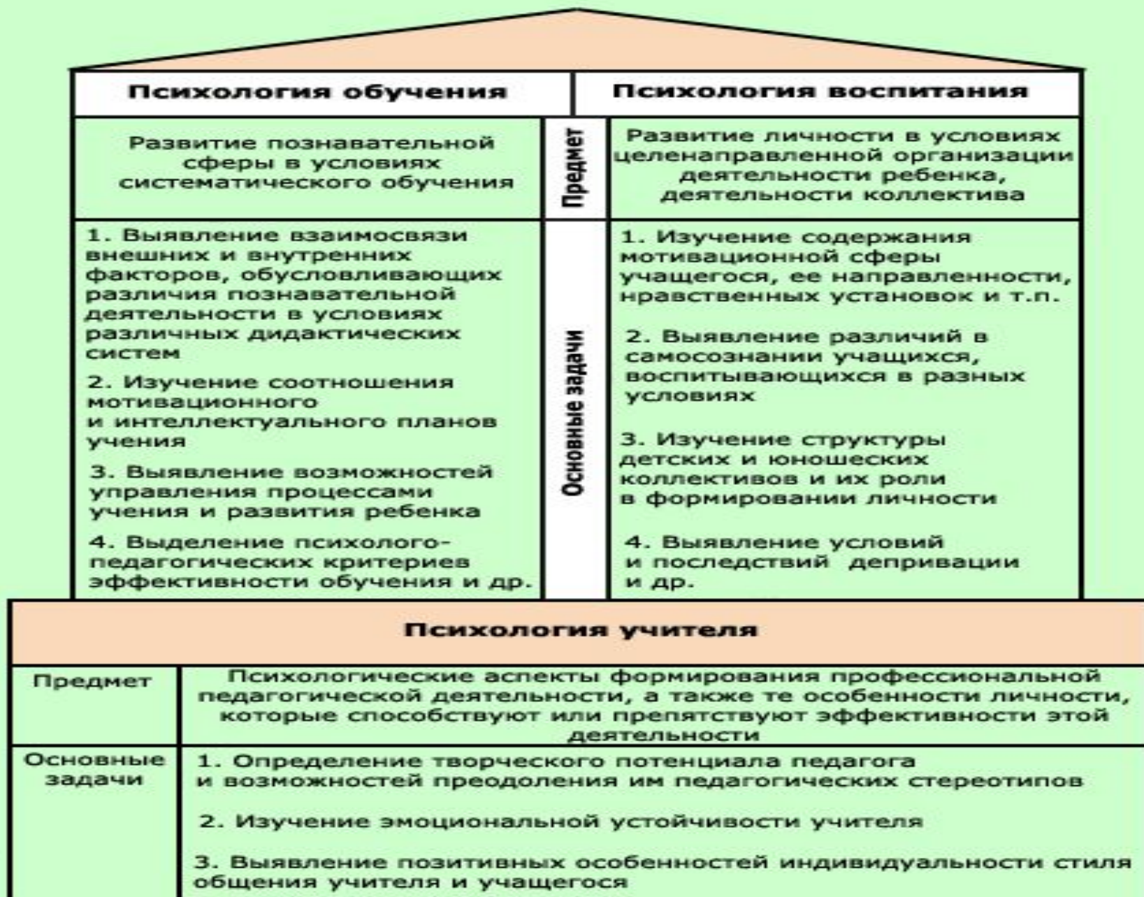
Рис. 2. Структура педагогической психологии