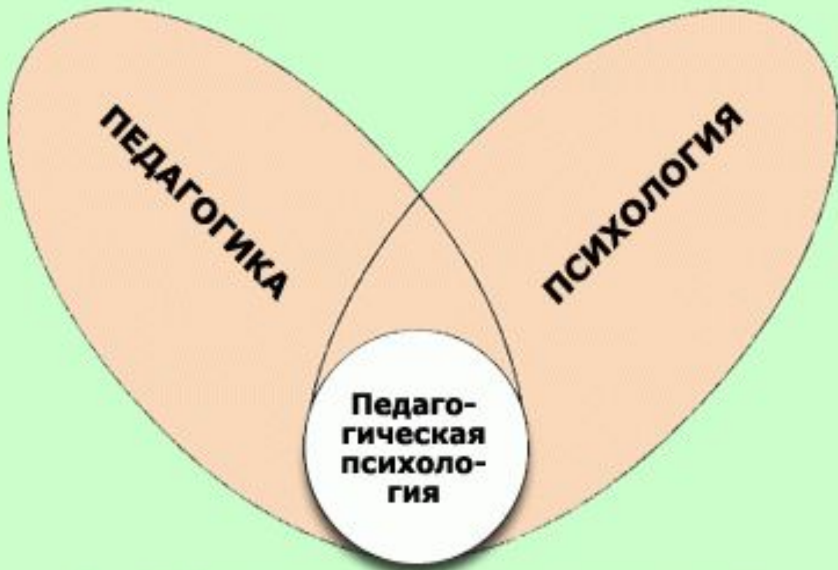
Рис. 5. Взаимосвязь педагогики с психологией