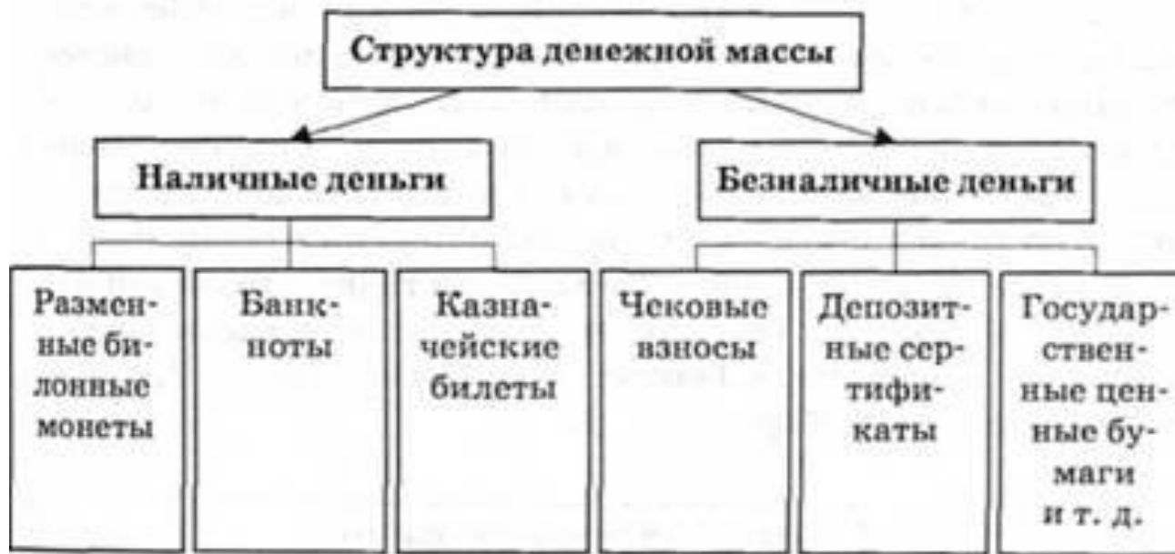
Рис. 6.6. Структура денежной массы