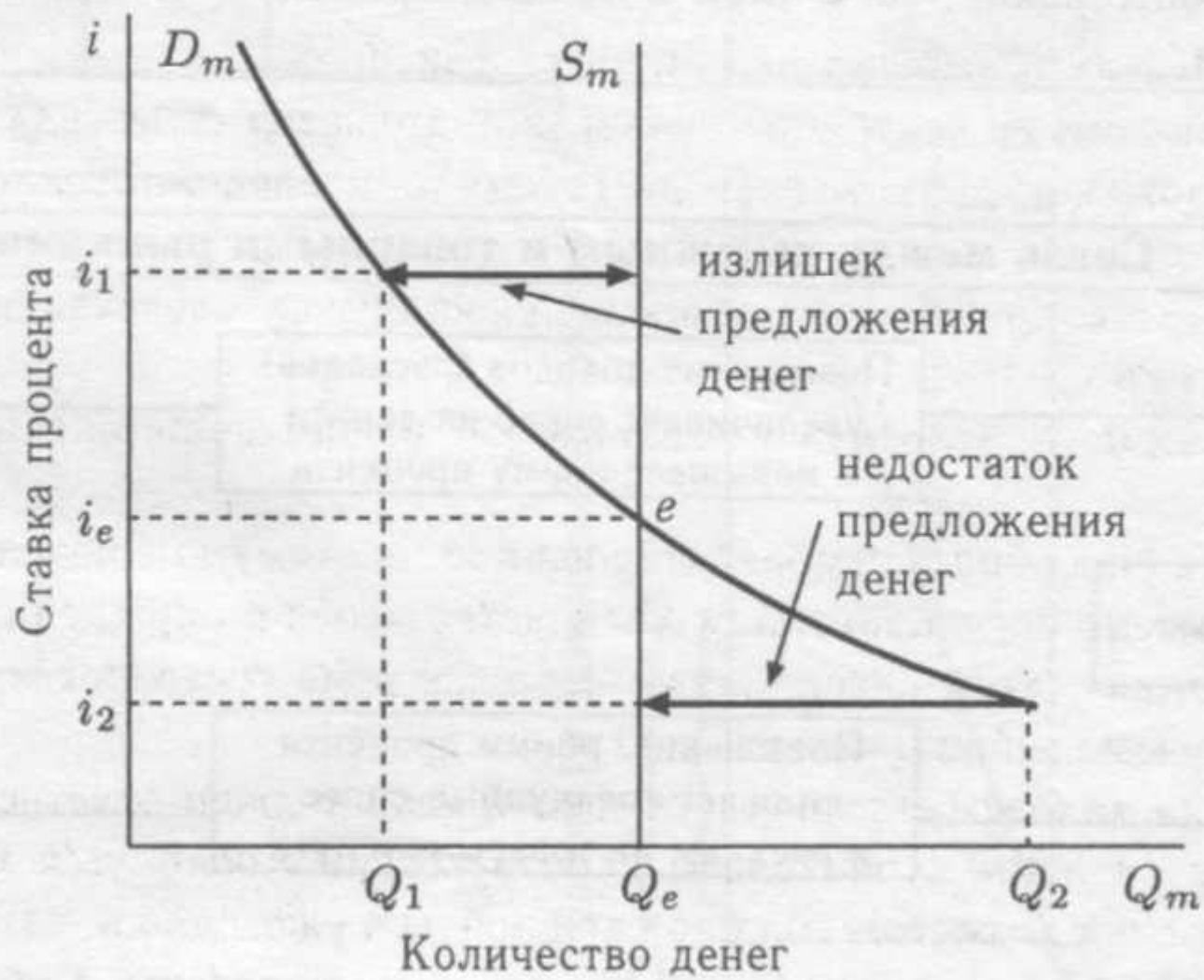
Рис. 18.1. Денежный рынок