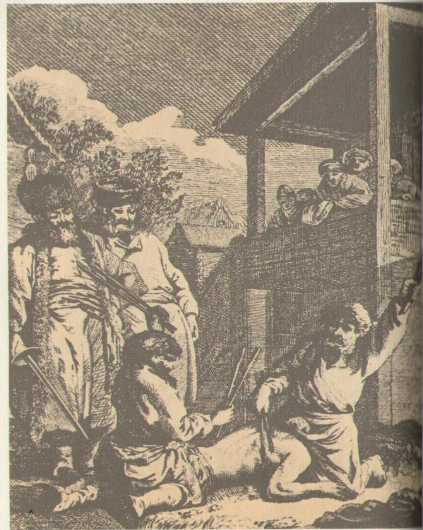
Наказание батогами. Гравюра XVIII в.