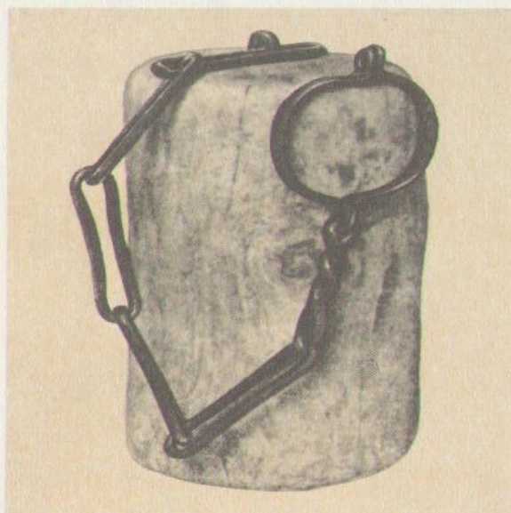
Ручные и ножные кандалы. XVIII в.