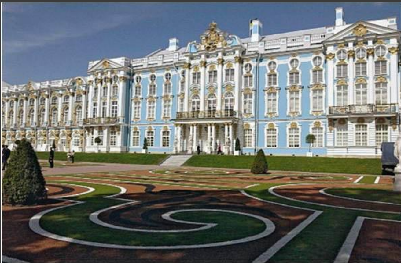
В.Растрелли. Дворец в Царском селе.