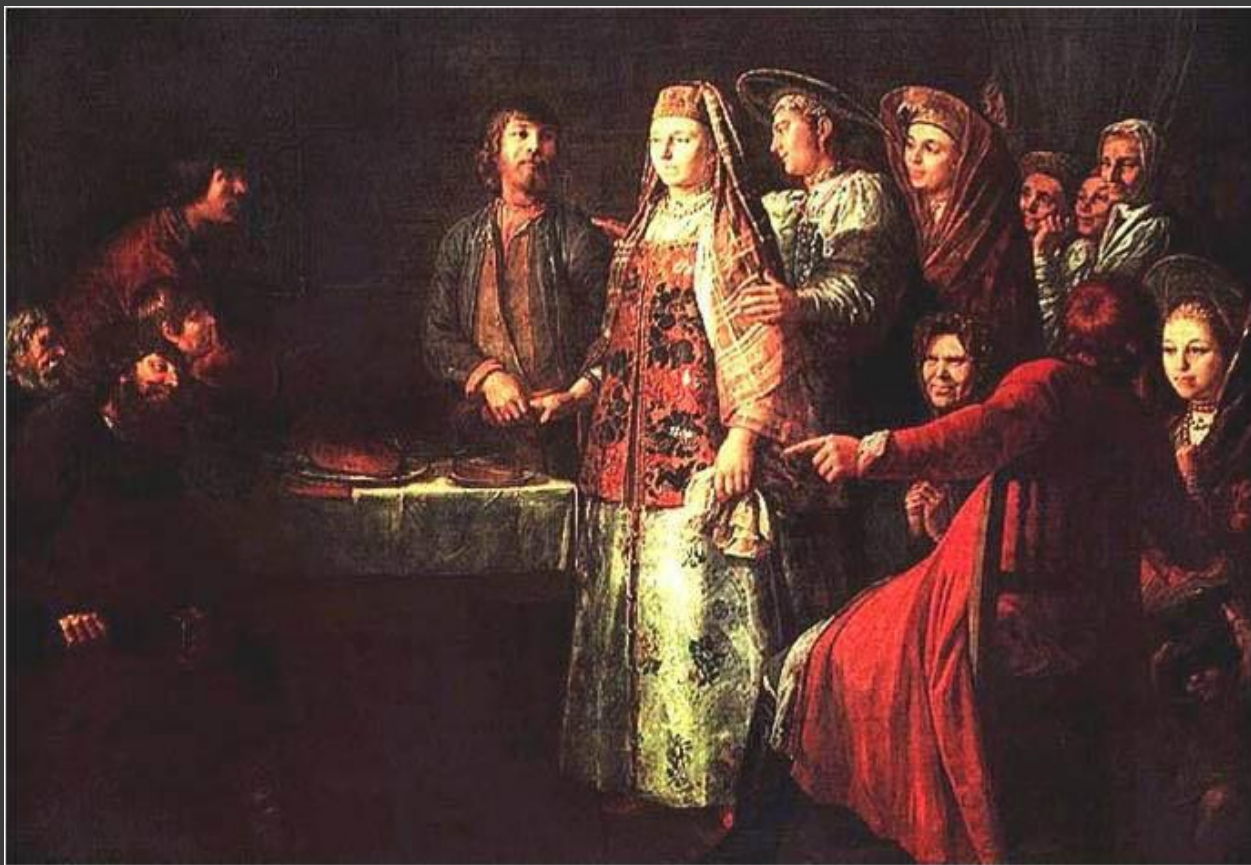
М.Шибанов. «Празднество свадебного договора»