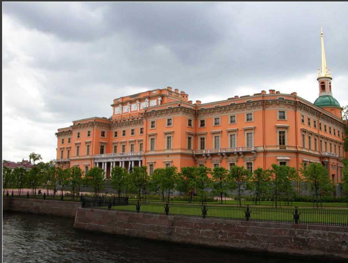
В.И.Баженов. Михайловский замок.