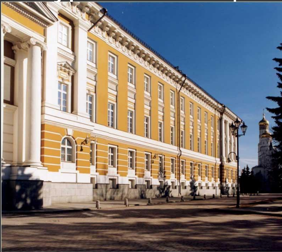
М.Ф.Казиков. Здание Сената в Кремле.