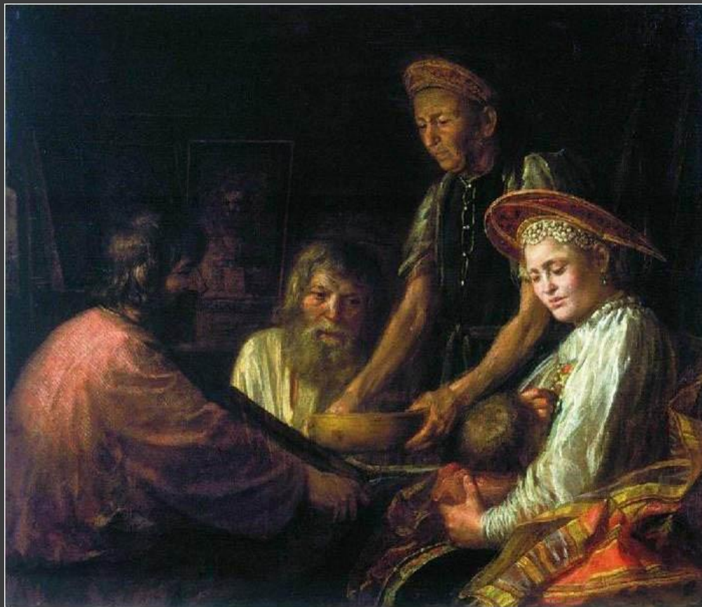
М.Шибанов. «Крестьянский обед»