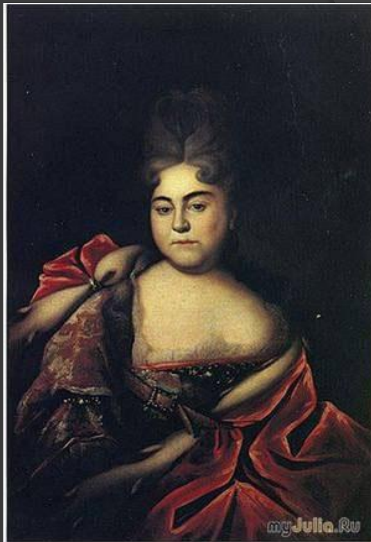
Никитин. Портрет царевны Натальи Алексеевны.

Светская живопись при Петре I выразила себя в портрете. Портреты сделаны в реалистичном духе, проникнуты психологизмом.