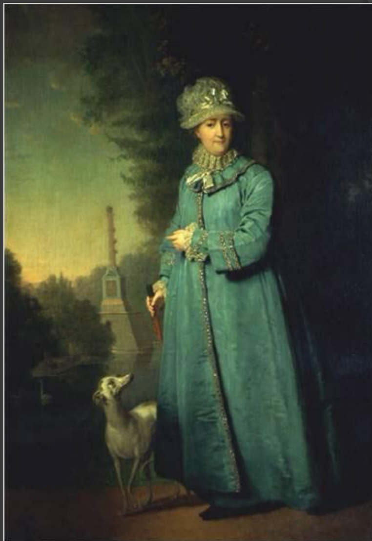
В.Л.Боровиковский. Портрет Екатерины II.