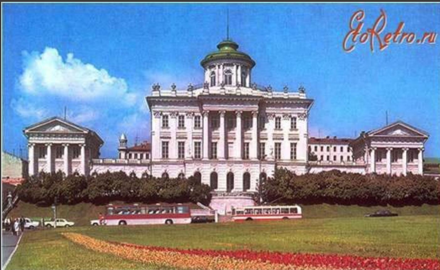
В.И.Баженов. Дом Пашкова в Москве