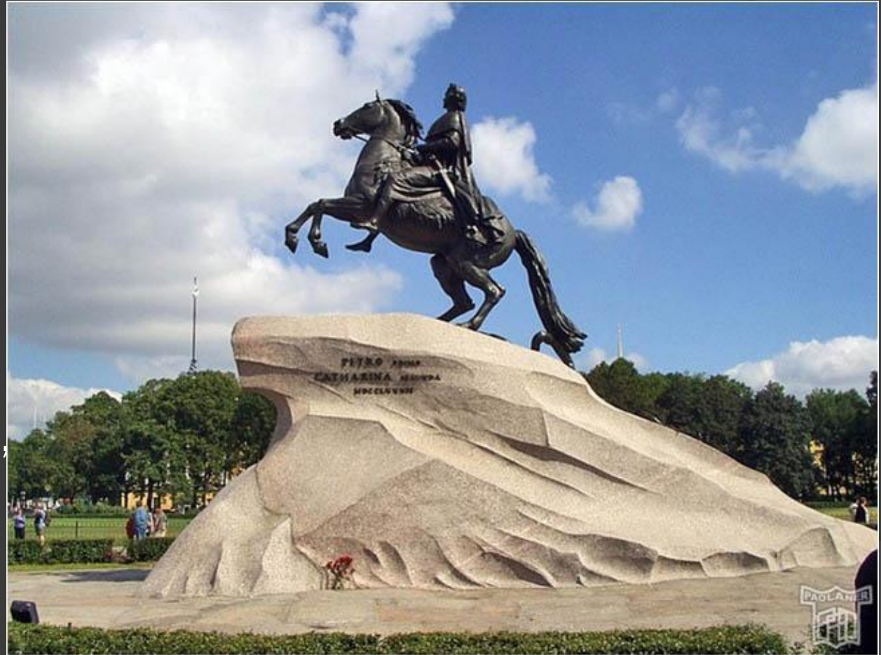
Фальконе. «Медный всадник».

Скульптура испытывала влияние классицизма. Ее отличает величественность, лаконичность и поэтическая выразительность.