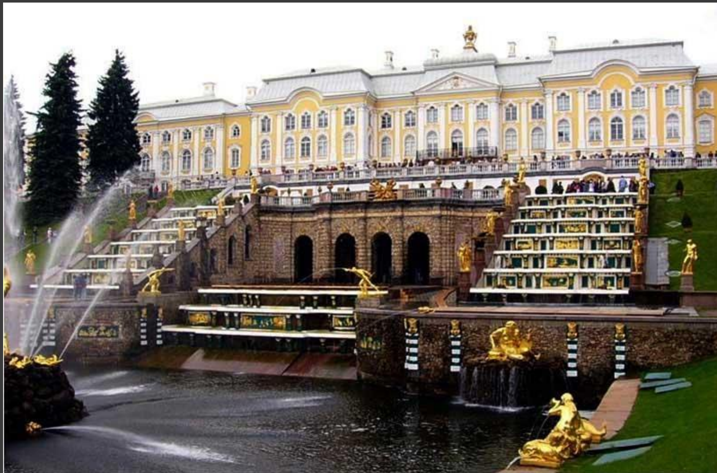
В.Растрелли. Большой дворец в Петергофе.