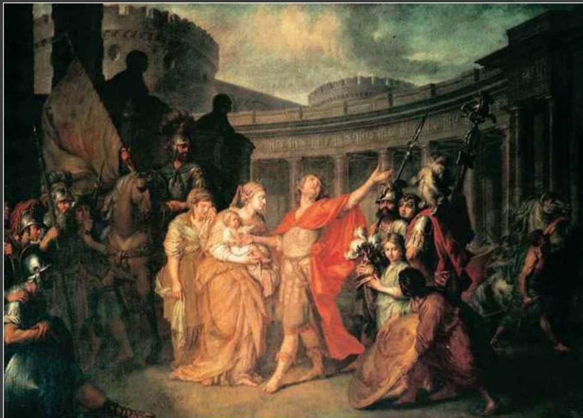
А.П.Лосенко. «Прощание Гектора с Андромахой».

подражание античным образцам, отвлеченность и идеальность образов.