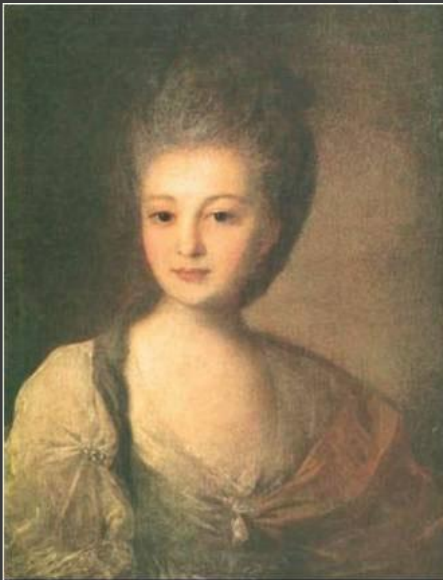
Ф.С.Рокотов. Портрет Струйской.