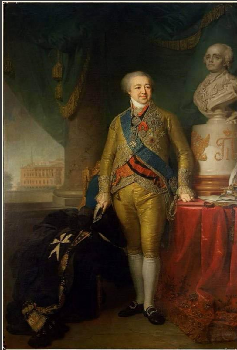
В.Л.Боровиковский. Портрет князя Куракина.