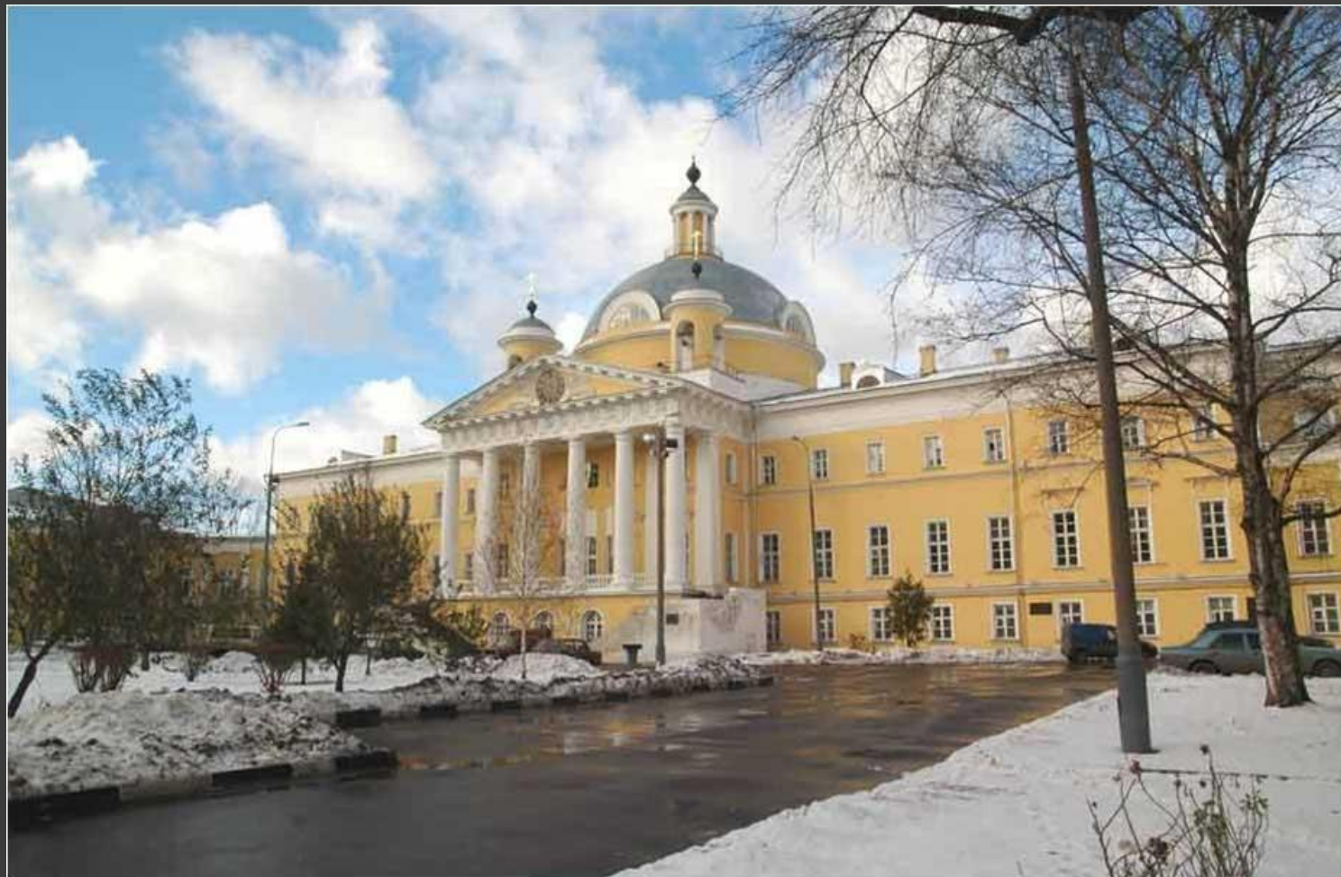
М.Ф.Казаков. Голицинская больница.