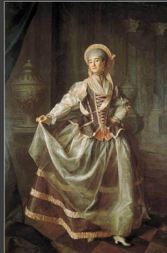
Д.Г.Левицкий. Портреты воспитанниц Смольного института.