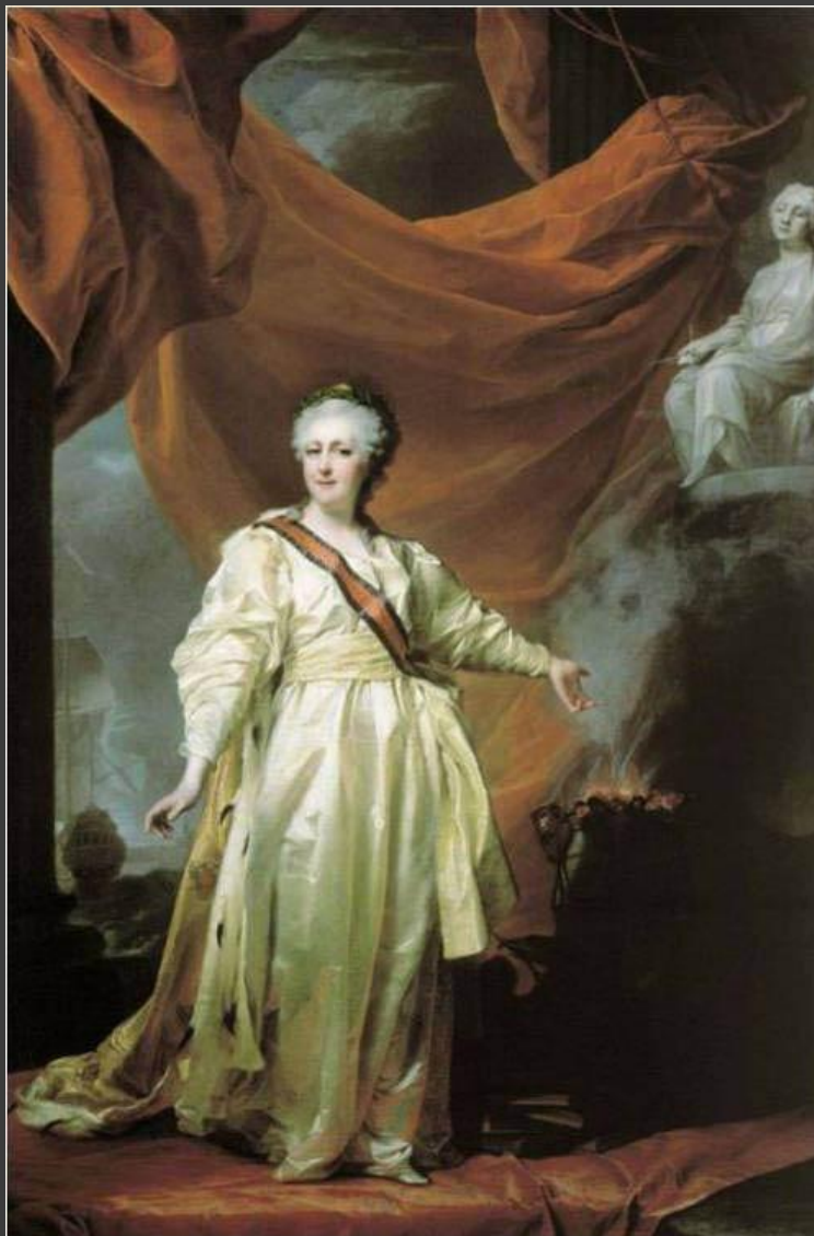
Д.Г.Левицкий. Портрет Екатерины II.