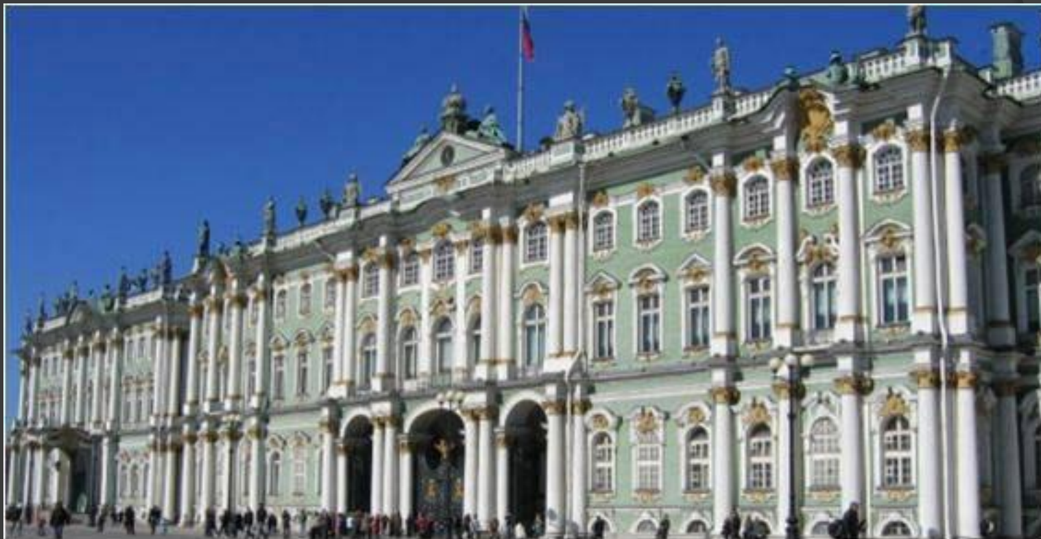
В.Растрелли. Зимний дворец.