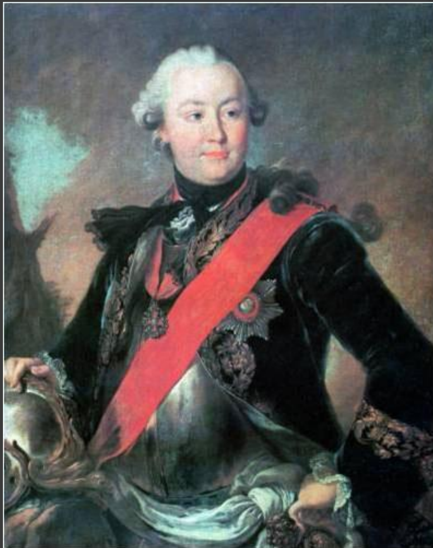
Ф.С.Рокотов. Портрет Г.Орлова.