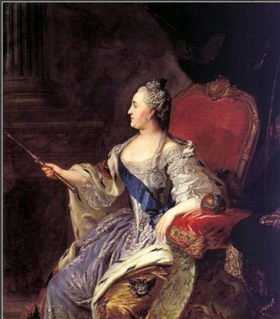
Ф.С.Рокотов. Портрет Екатерины II.