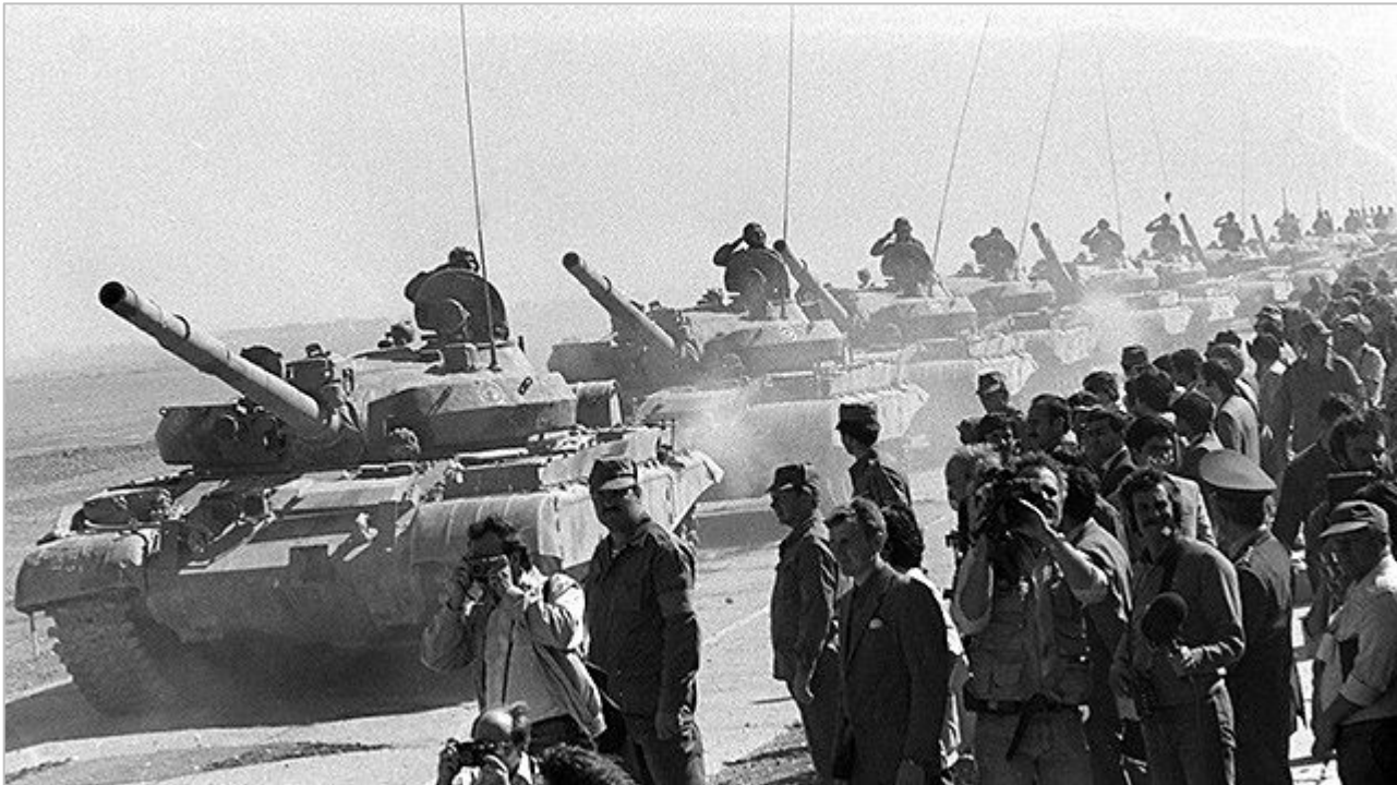
Советские танкисты возвращаются на Родину. Февраль 1989 года.