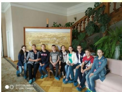
Ученики 6"б" и 7"б"

Нам очень понравилась эта экскурсия. Было очень интересно и познавательно. Спасибо большое администрации школы за возможность посещать такие исторические места!