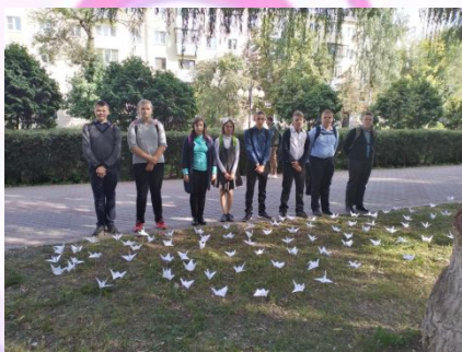
Память трагедии в Беслане.

3 сентября - День трагедии в Беслане. Беслан и вся Россия переживает жуткую годовщину — 15 лет назад, 1 сентября 2004 года, боевики атаковали школу №1. Ворвавшись на торжественную линейку в честь Дня знаний, они взяли в заложники более тысячи человек, включая несовершеннолетних, их родителей и сотрудников учебного учреждения. Трагедия унесла жизни 333 мирных граждан, в том числе 186 детей. За первый день террористической атаки боевики расстреляли несколько десятков школьников, их родителей и учителей.