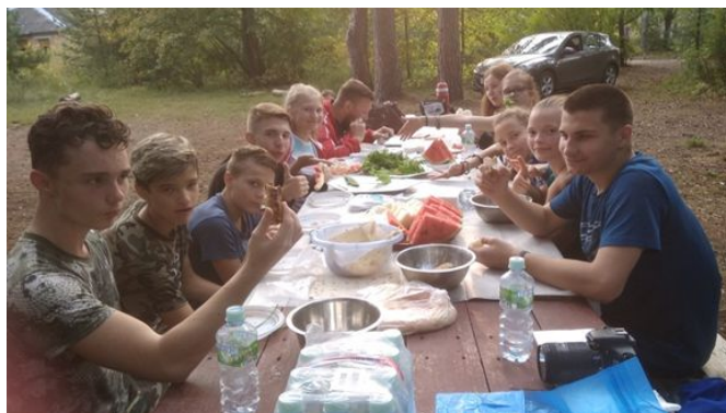
Ученики 8 «А» класса

Поездка нам очень понравилась. Надеемся, что приедем ещё не раз в этот центр.