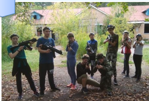
Поездка в «Партизан»

5 сентября мы вместе с родителями ездили в центр военно – патриотических игр «Партизан». Эта поездка была нашим призом по итогам учебного года школьного движения «Наша марка». Мы уже второй год приезжаем туда. Впечатления от поездки самые лучшие!