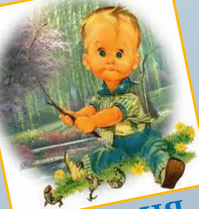
Ва н я