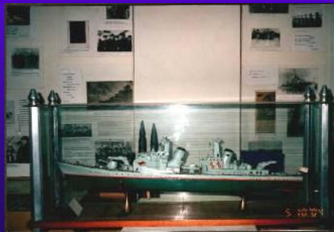
фото №19 Макет боевого корабля 50-х годов.