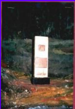
фото №16 Макет памятной стелы.

Макет стелы хранится в школьном музее ( фото №16 ). А также хранится много вещей, рассказывающих о героическом прошлом нашего города. Это и каски, и осколки, дошедшие до наших дней с времён Великой Отечественной войны ( фото №17 ), и парадный китель контр-адмирала Максименкова И. Г. ( фото №18 ), и модели военных кораблей ( фото №19 ).