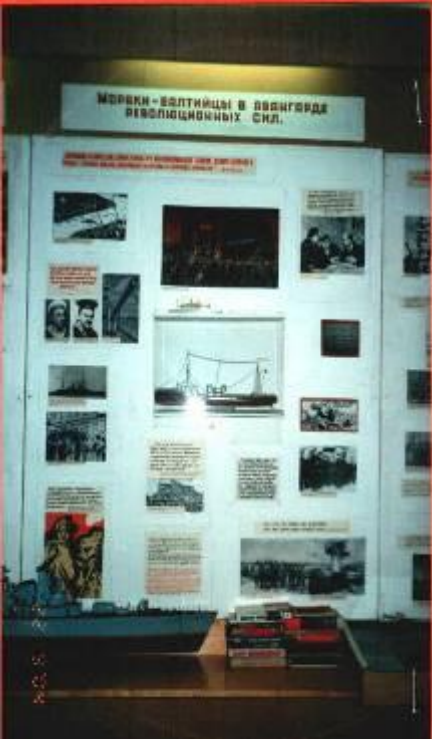
Фото 7. Стенд, посвященный революционному движению и образованию красного флота.