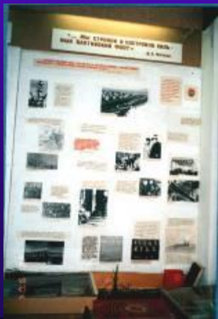
фото №8 «Мы строили и построили сильный Балтийский флот».