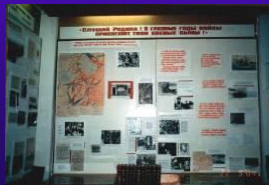
фото №9. «Слушай Родина! В грозное время войны присягают твои боевые сыны!»