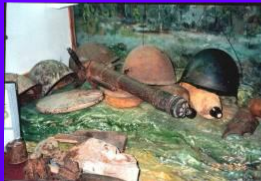
фото №17 Осколки снарядов и каски дошедшие до наших дней с времён Великой Отечественной войны.