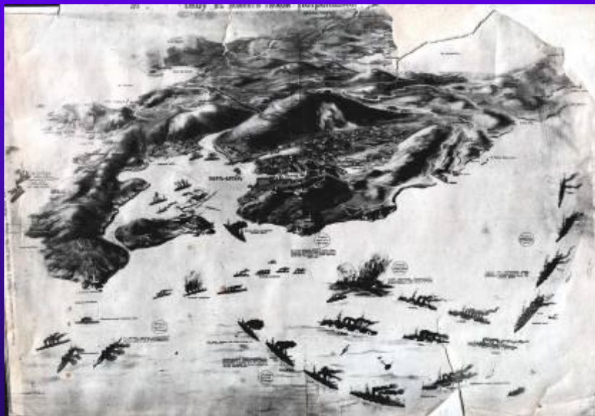
фото №6 Действие русской эскадры при битве Порт – Артура.

Второй эскадренный миноносец «Стройный» был также построен на Невском судостроительном заводе в 1907 г.; включен в состав 9-й минной дивизии Балтийского флота. По всем тактико-техническим данным он превосходил предшественника. Во время первой Мировой войны 1914 – 1918 г. г. эсминец нес дозорную службу, охранял большие корабли, ставил мины в Балтийском море, участвовал в обороне Рижского залива, обеспечивал прикрытие минно-заградительных операций. С 8 по 21 августа 1915 года участвовал в Ирбенской операции. 28 августа 1917 года при уклонении от атаки германского гидросамолета в Рижском заливе сел на мель. При повторном налёте получил прямое попадание авиабомбой и лег на грунт. После ремонта, по некоторым сведениям, эсминец был переброшен в Каспийскую флотилию, где и погиб при обороне Царицина.