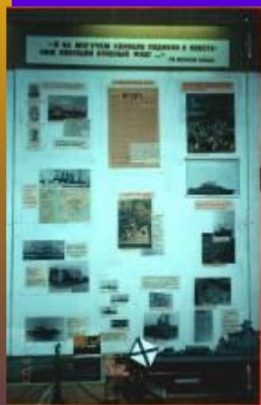
фото 5. Стенд, иллюстрирующий новаторство русских ученых – кораблестроителей. Первый эсминец «Стройный» 1904-1905 г. г. и второй эсминец «Стройный» 1907-1918 г. г. (нижний левый угол стенда).