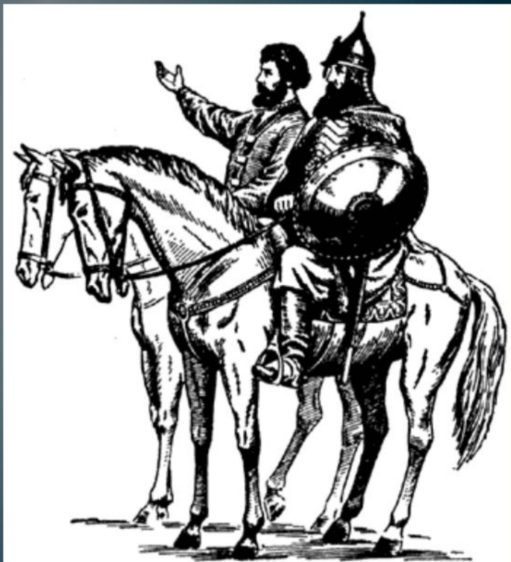
Дмитрий Пожарский и Кузьма Минин