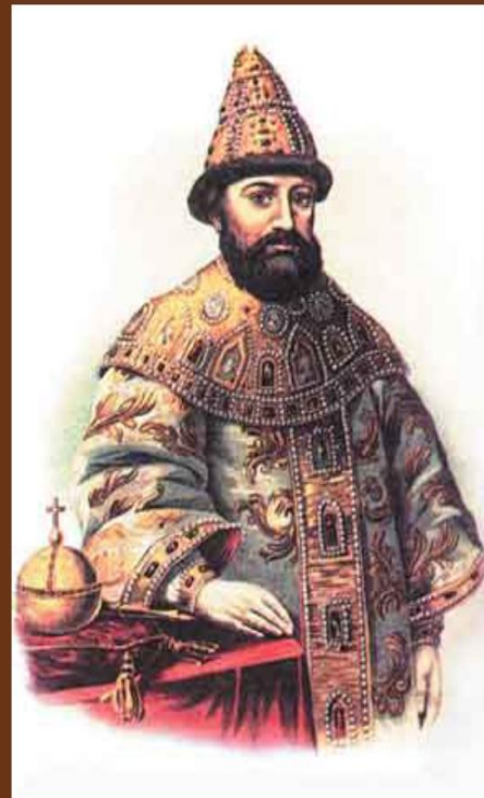
Царь Михаил Фёдорович Романов (годы правления 1613-1645)

Земский собор, собравшийся в начале 1613 г., избрал на царство Михаила Романова (1613-1645), ставшего родоначальником новой династии. С утверждением на царство Михаила Фёдоровича в основном завершается период Смуты в России.