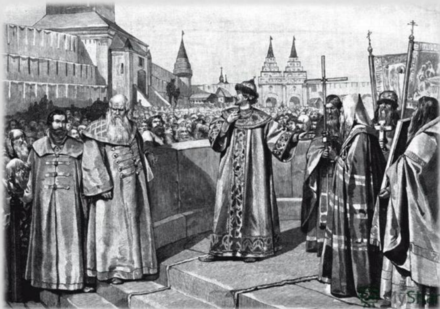
«Царь Иоанн IV Грозный открывает первый Земский собор своею покаянною речью»

Первый Земский Собор был созван в 1549 году. Кроме бояр, дворян и духовенства на соборе были выборные от посадов и торговых людей, а также от черносошных крестьян. Выборы царей на земских соборах конца 16 - начала 17 века стали наиболее ярким событием политической истории России.