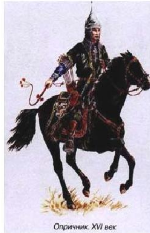
Опричник. XVI век

Черная одежда грубого сукна, прикрепленная к седлу собачья голова и метла, означало, что слуги-опричники подобно псам будут грызть крамольников и выметут всю измену из Московского государства. Всем своим видом опричники наводили ужас на встречных.