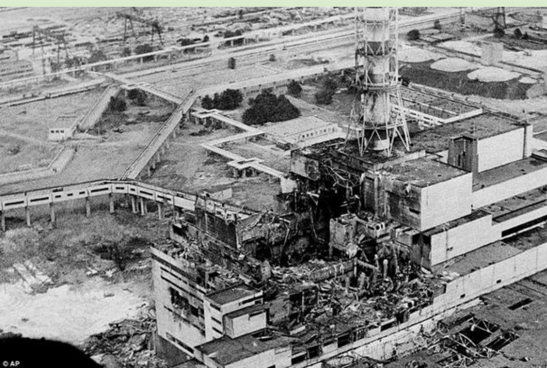
Авария на Чернобыльской АЭС, 1986г.