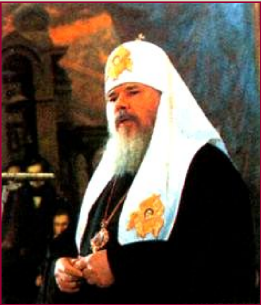
Патриарх Алексий II.

Начавшаяся демократизация общества привела к изменению отношений государства и церкви. Началось возвращение верующим культовых зданий, были сняты ограничения на церковные обряды.