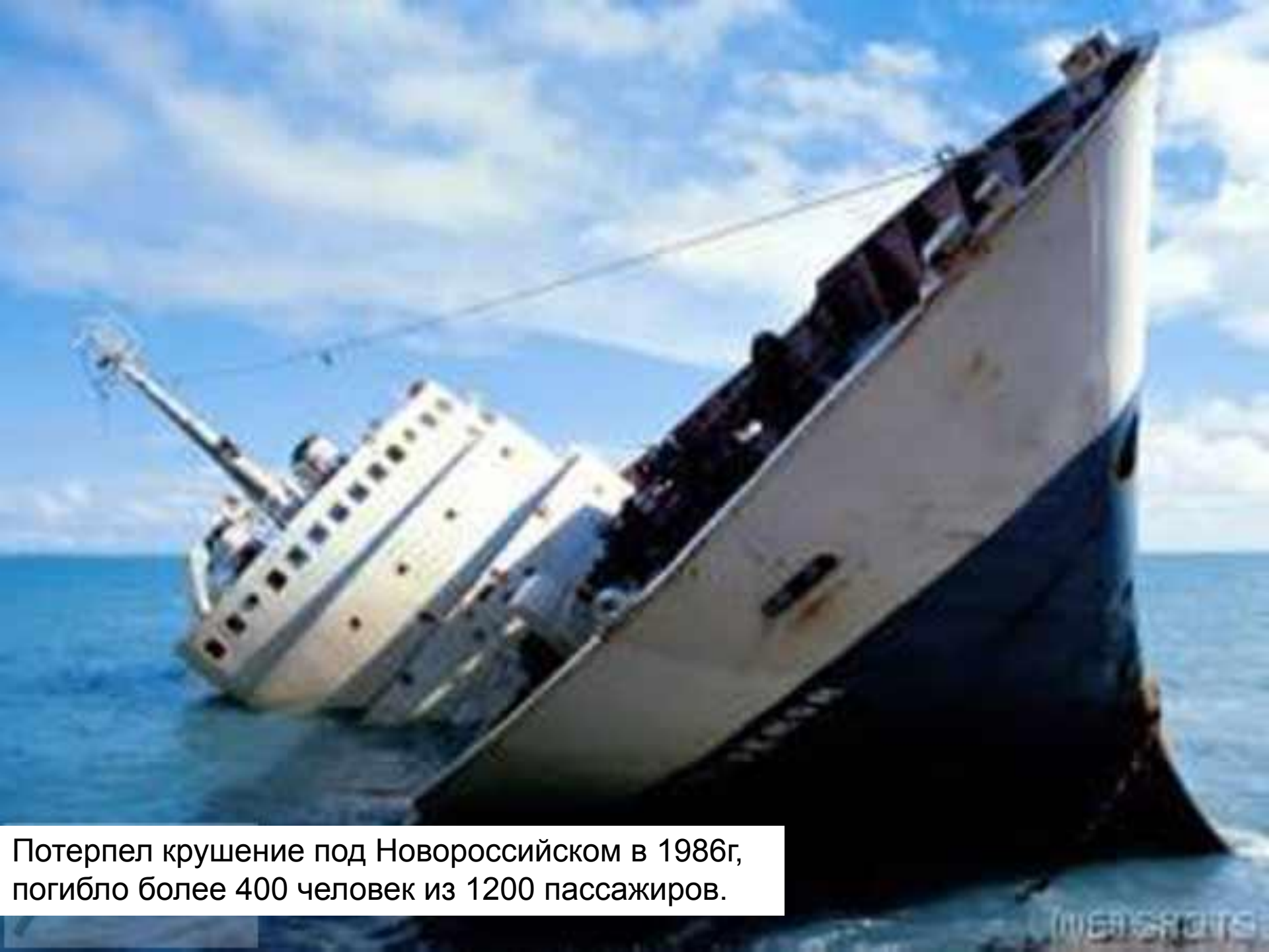
Потерпел крушение под Новороссийском в 1986г, погибло более 400 человек из 1200 пассажиров.