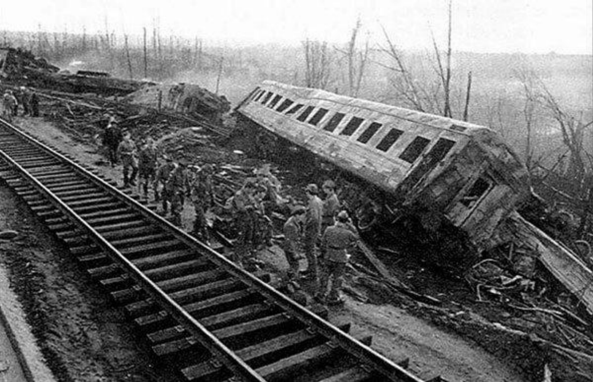
Ашинская катастрофа, июнь 1989г . Погибло около 600 человек, 181 из них –дети.