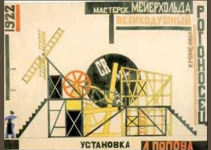
Л. С. Попова. Чертёж сценической конструкции для спектакля «Великодушный рогоносец». 1922 г.

Живопись этот принцип реализовала в соответствии с двухмерностью пространства: абстрактность форм и структуры располагались на поверхности, подобно чертежу архитектора и машинной технологии.