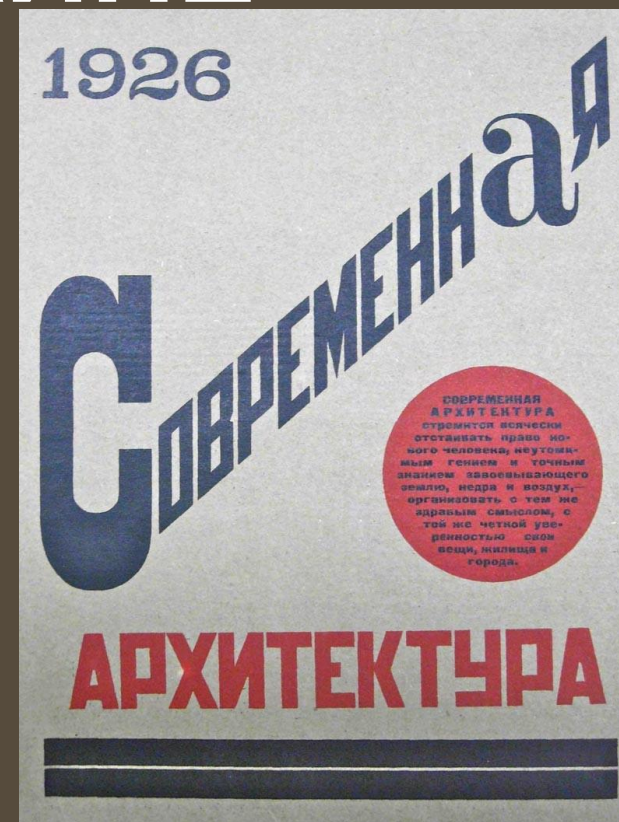
Обложка журнала «Современная архитектура» (автор А. Ган)