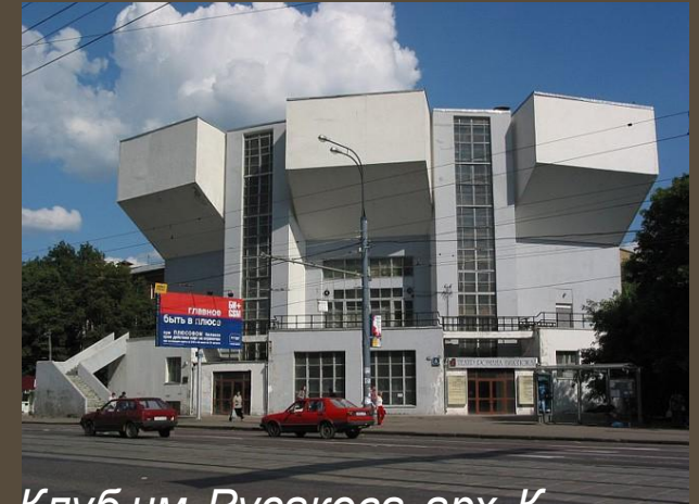
Клуб им. Русакова. арх. К. Мельников.