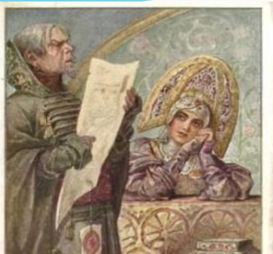
С. Соловьев. Писец

• Правда искусства – это реальность, пережитая человеком.