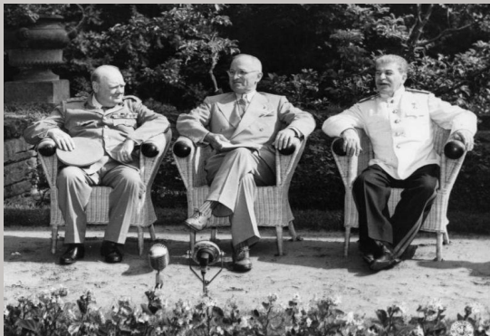
У. Черчилль, Г. Трумэн, И. Сталин