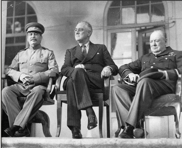
И.В. Сталин, Ф.Д. Рузвельт, У. Черчилль