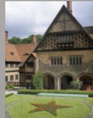
Дворец Цецилиенхоф — место проведения Потсдамской конференции