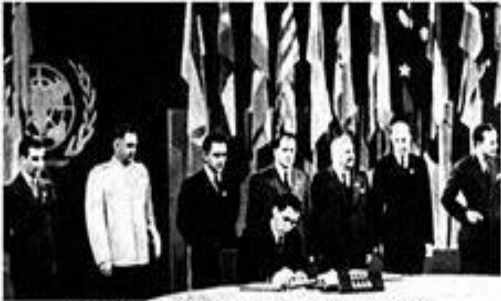
А. А. Громыко подписывает Устав ООН. Сан-Франциско. 26 июня 1945 года.