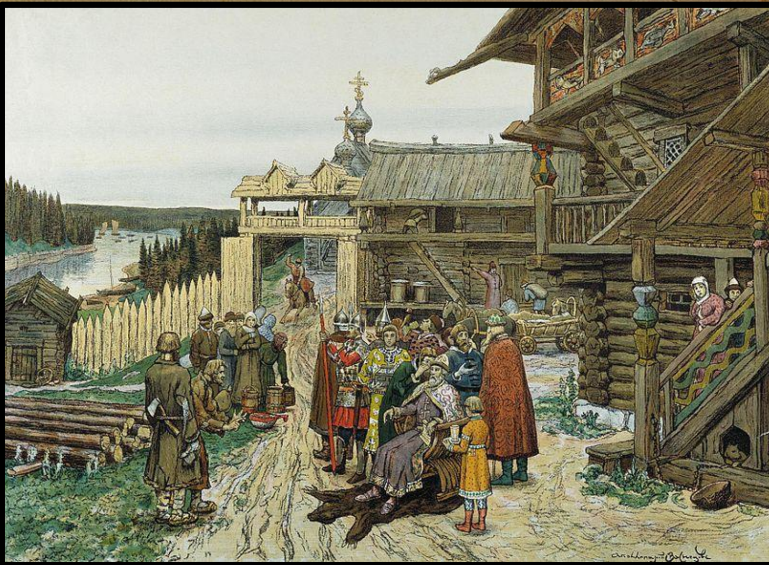
Рисунок 1. Двор удельного князя периода феодальной раздробленности