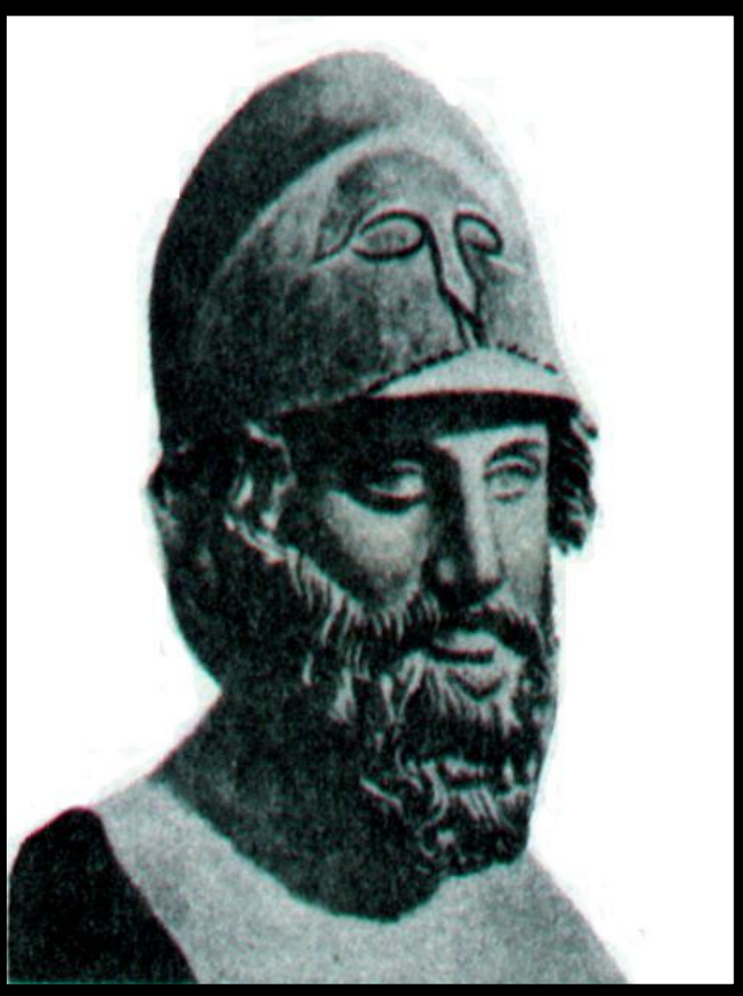
Фемистокл. Древнегреческая скульптура.

После Марафонской битвы угроза со стороны Персии сохранялась. Это прекрасно понимал Фемистокл. По его предложению афиняне построили флот в 200 триер. Благодаря Фемистоклу 30 эллинских государств создали союз против персов.