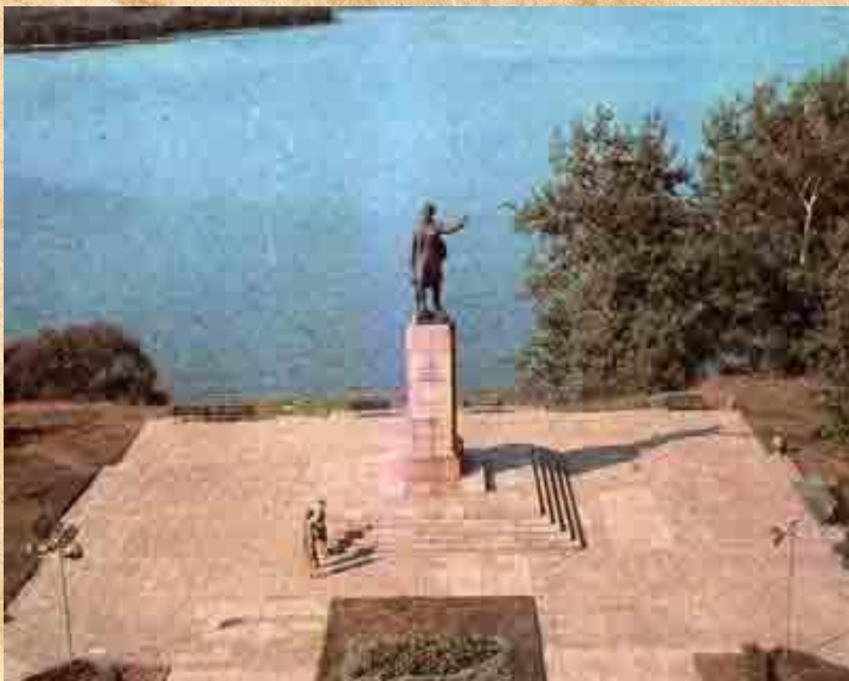
Берег озера Зарасас в Литве памятник Марите Мельникайте

В 1955 г. в городе Зарасай ей был установлен памятник скульптор Юозас Микенас. В настоящее время он находится в парке Грутас.