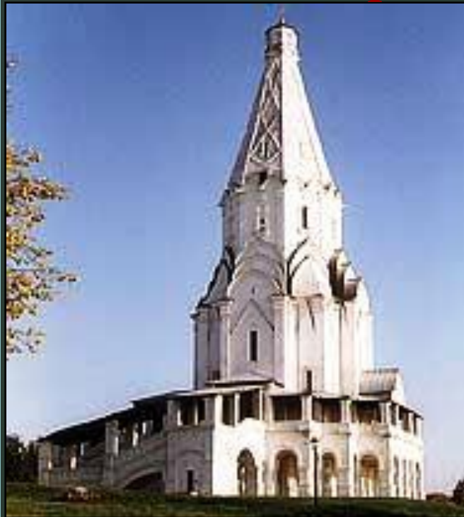
Церковь Вознесения в селе Коломенском