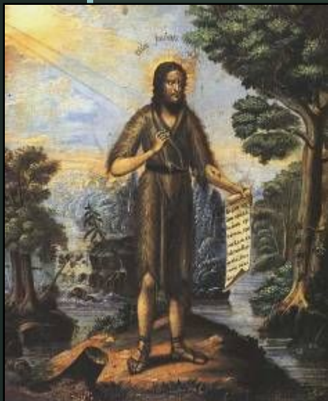
«Иоанн Предтеча в пустыне». Прокопий Чирин