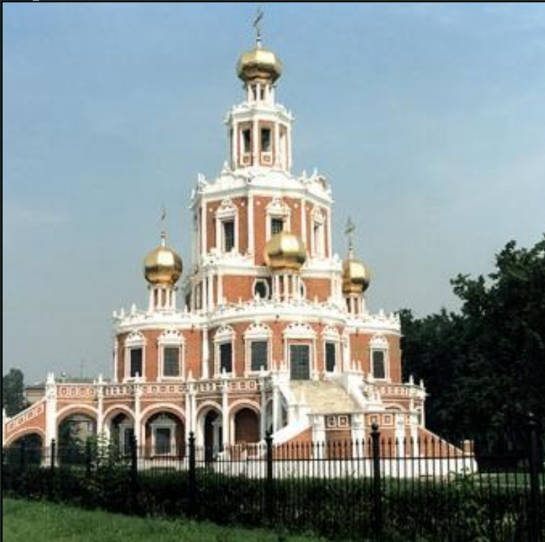
Храм Покрова Богородицы в Филях – усадебная церковь Нарышкина Л.К.

Барокко – (от ит. barocco – причудливый, вычурный) – это художественный стиль, отличающийся пышностью, причудливостью деталей.