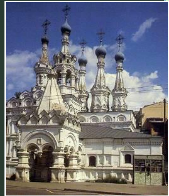
Церковь Рождества Богородицы в Путинках

1652 г. – запрет на строительство храмов шатрового стиля