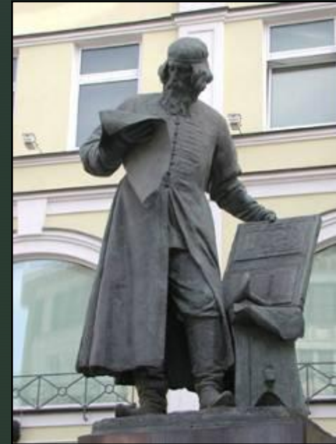
Иван Федоров (Москвитин) Петр Тимофеев Мстиславец