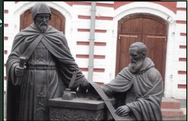
Иоанникий и Софроний Лихуды

1687 год - Славяно – греко – латинское училище