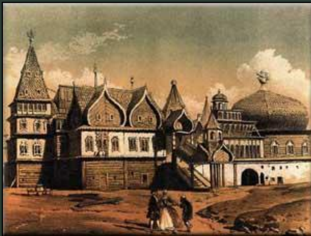
Деревянный дворец царя Алексея Михайловича в селе Коломенском