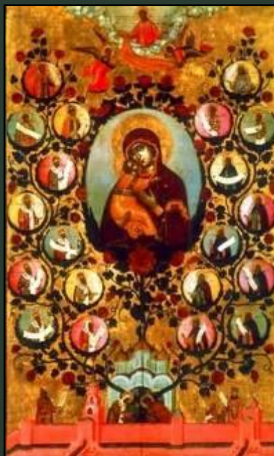
«Насаждение древа государства Российского». Симон Ушаков