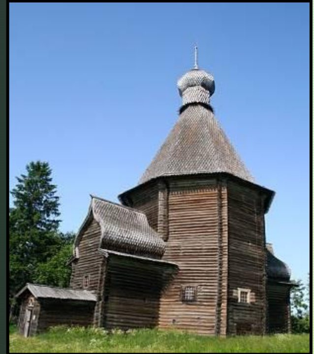
Никольская церковь в селе Лявля Архангельской области

Шатровый стиль архитектуры – вид архитектурного сооружения, завершающегося высокой многогранной пирамидой