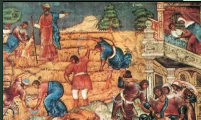
«Деяния пророка Елисея». Гурий Никитин