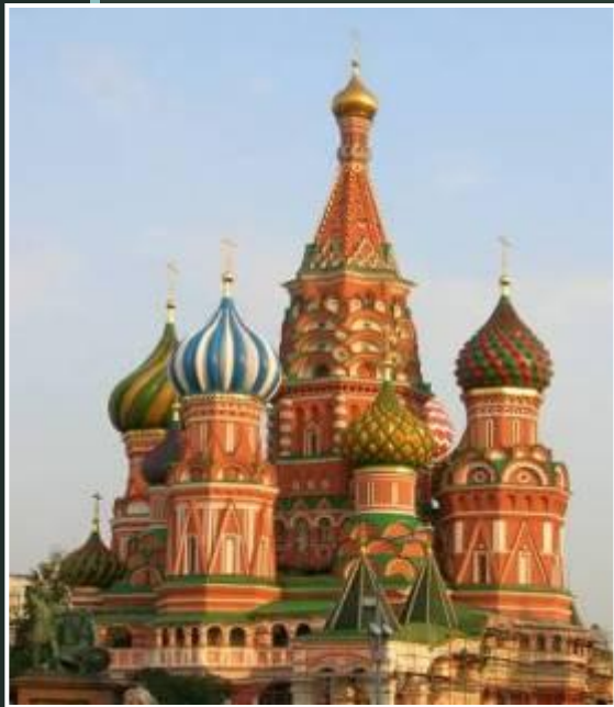
Церковь Покрова Богородицы на Красной площади