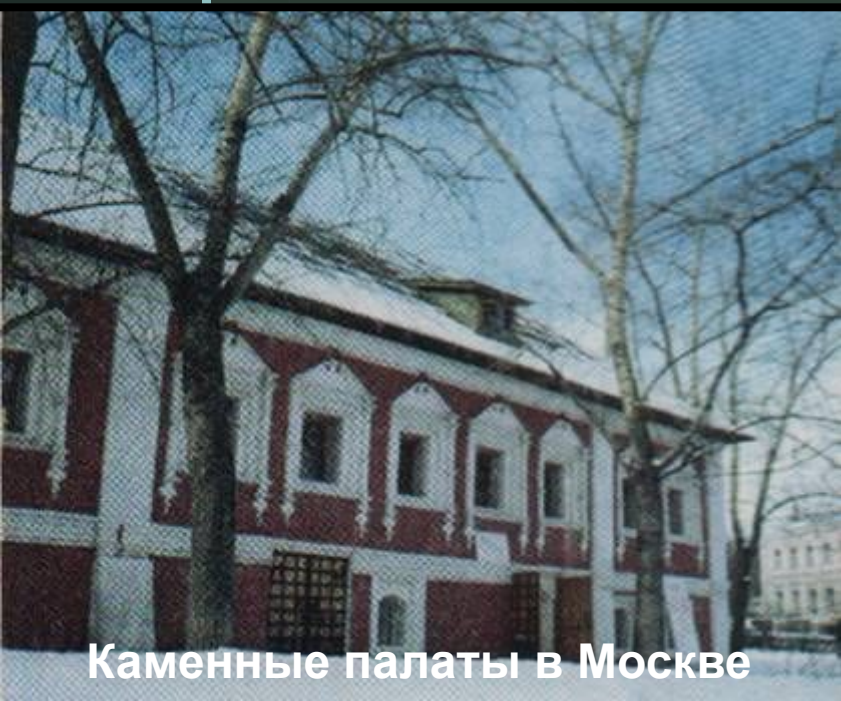
Каменные палаты в Москве