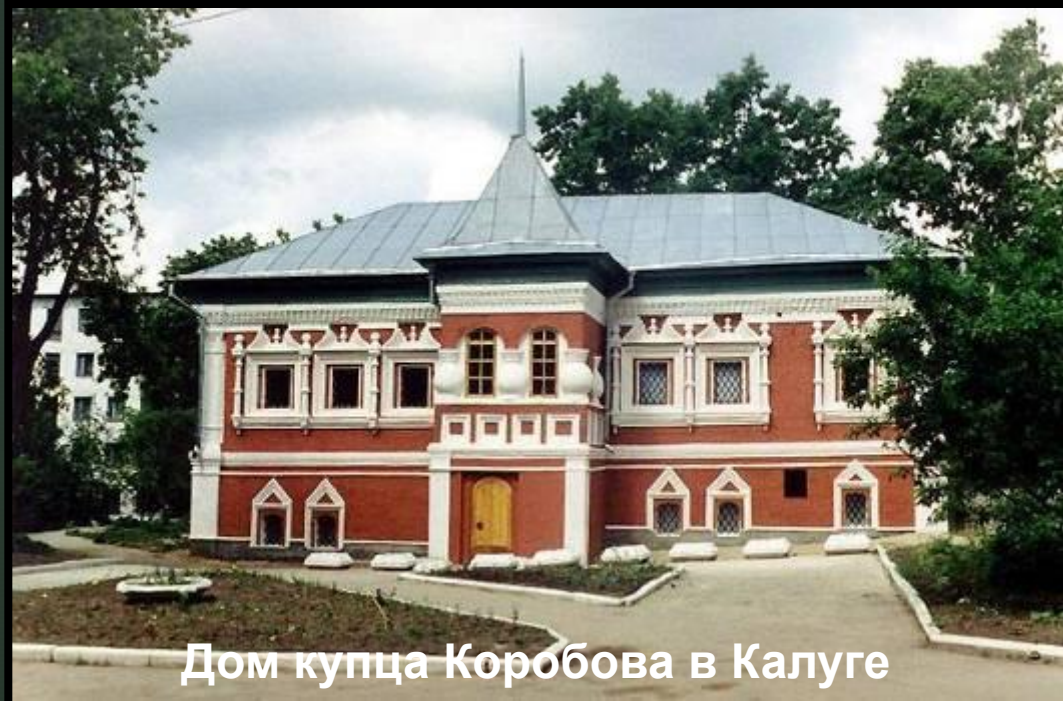
Дом купца Коробова в Калуге