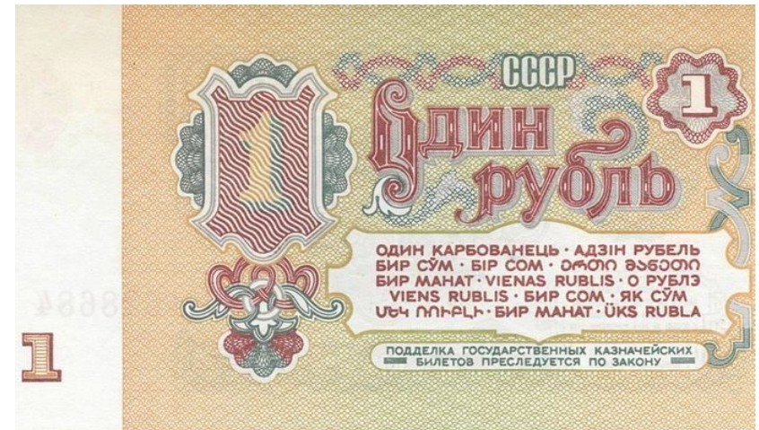
Единая денежная единица СССР

Почему рубль дешевле доллара, английский фунт дороже евро?