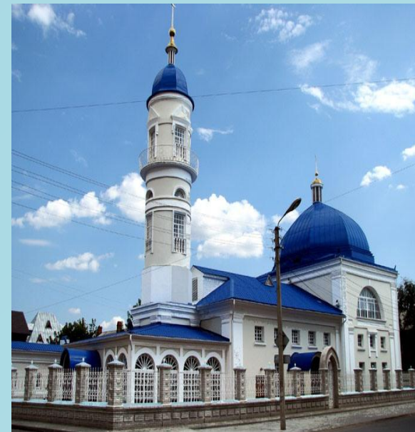
Древнейшая мечеть в Астрахани