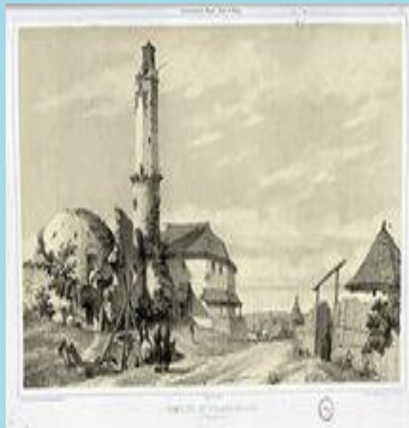
Мечеть в татарском селе

На территории современной России издавна жили мусульмане. Ещё во времена князя Владимира на Волге существовало мусульманское государство Булгария. Ещё раньше ислам начал распространяться среди жителей Северного Кавказа. В XVI веке в состав Российского государства вошли народы, религией которых был ислам. Мусульмане многое сделали для процветания нашей