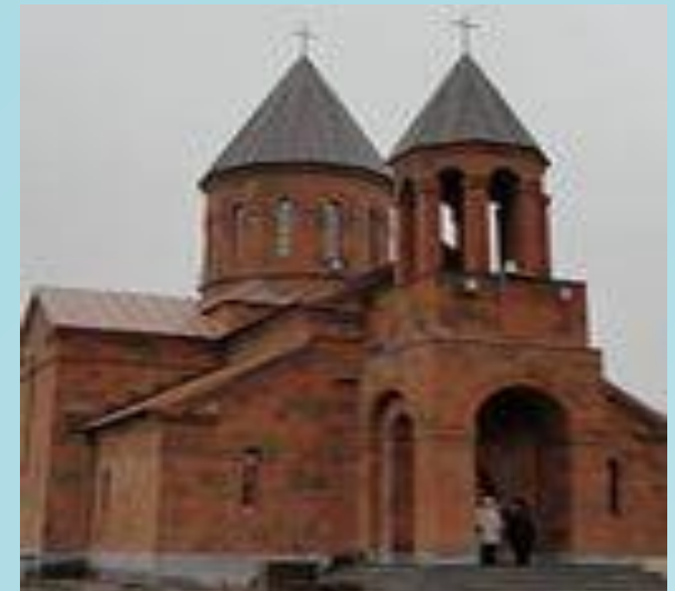
В Нижнем Новгороде