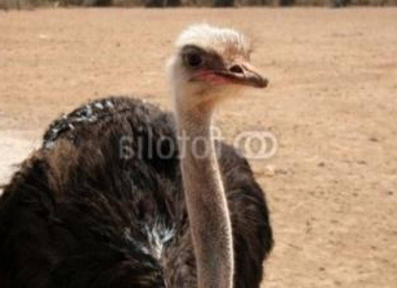
ostrich [ˈɒstriːtʃ] страус