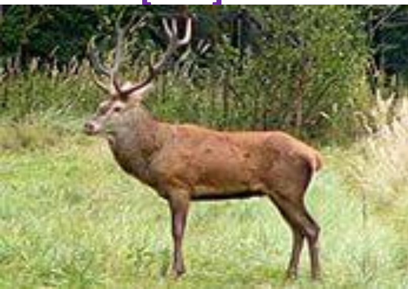
deer [diə] олень