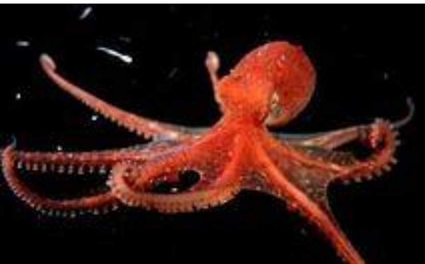
octopus [ˈɒktəpəs] осьминог