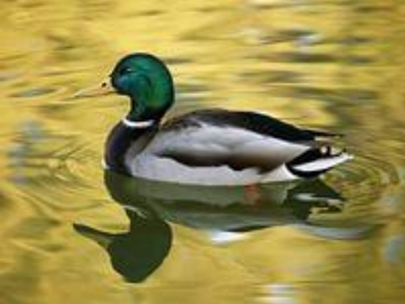
duck [dʌk] утка