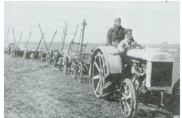
Новая техника на колхозных полях.