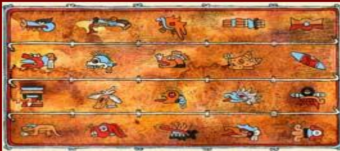
Рисунок на коже календаря ацтеков