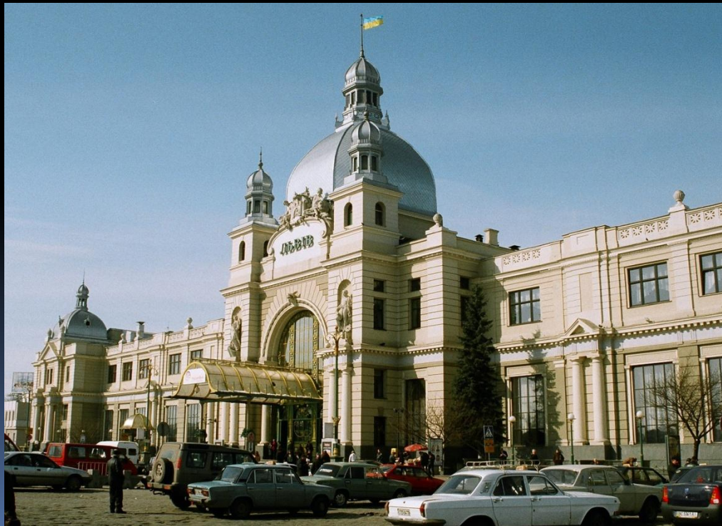
Львівський залізничний вокзал

У стилі Модерну побудовано залізничні вокзали Львова, Києва, Жмеринки, Харкова, перший в Україні критий ринок (Бесарабський).