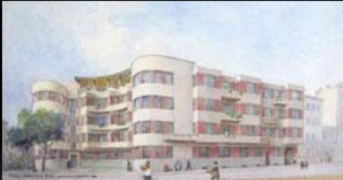
Перший будинок кооперативу «Радянський лікар» Проект. Перспектива. 1928 р. Архітектор П. Альошин

До частини сюди належать і будинки, споруджені П. Альошиним.