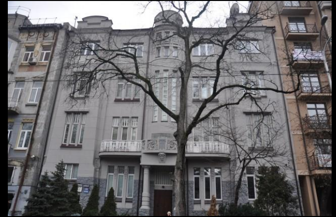
доходный дом Трофимова арх. И.Ледоховский