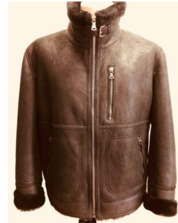
Дубленка «авитор» темно-коричневого цвета