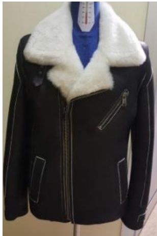
Дубленка с асимметричной застежкой, контрастным светлым мехом и с контрастной отделкой швов