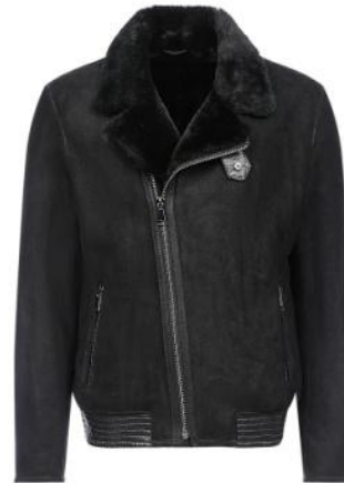
Дубленка «бомбер» с асимметричной застежкой