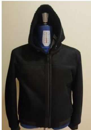
Дубленка «бомбер» с капюшоном