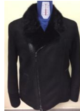
Дубленка средней длины с асимметричной застежкой