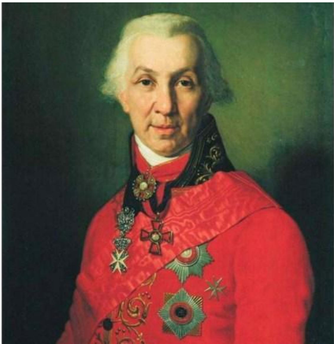
Портрет Г. Державина работы В. Боровиковског 1811 г.